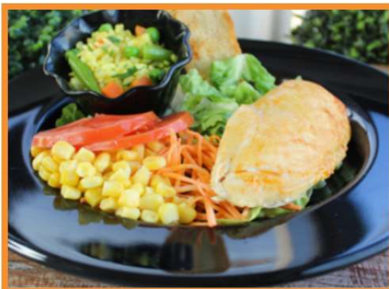
Pechuga de pollo asado