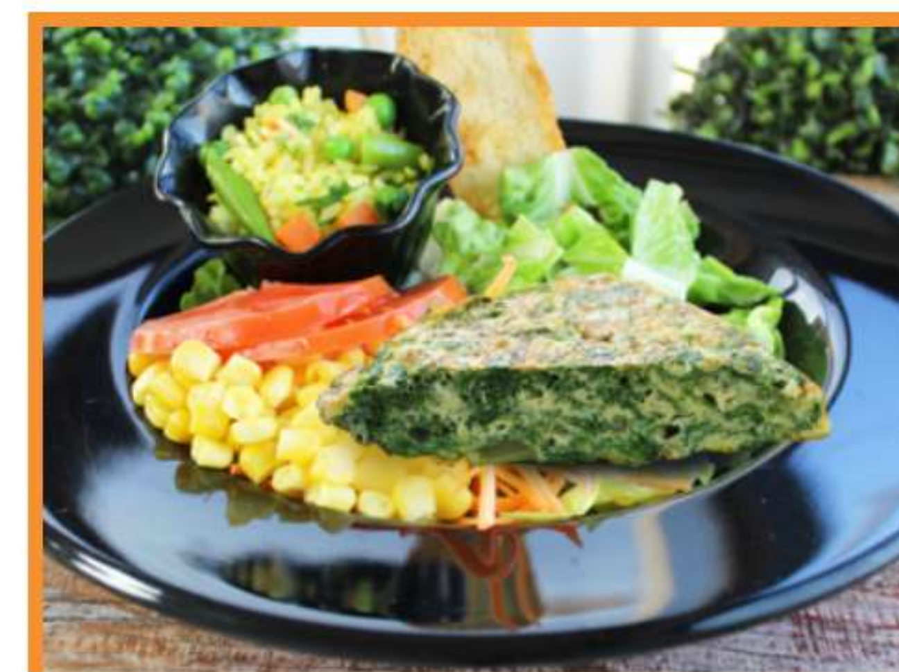
Tortilla de acelgas