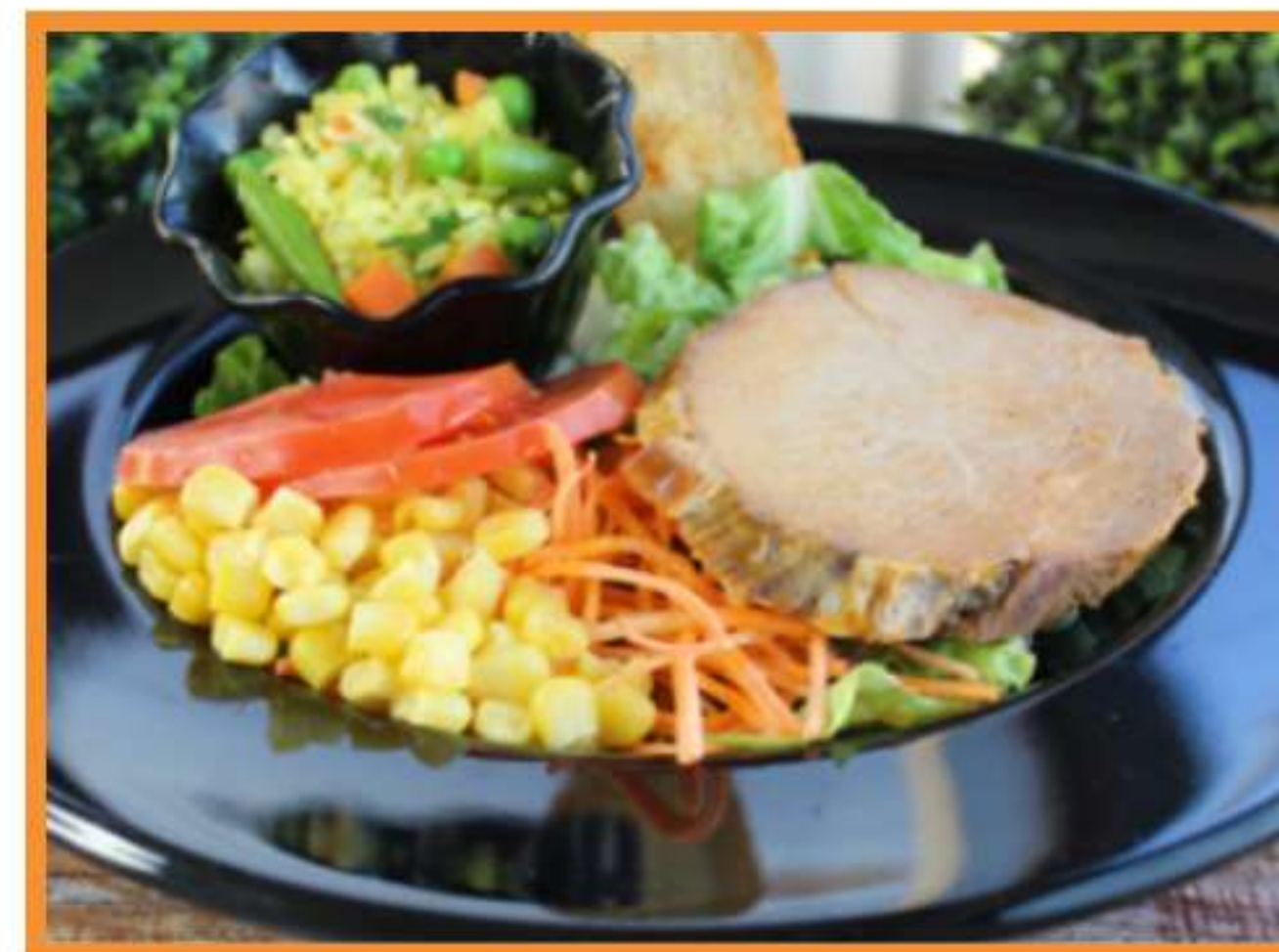
Carne al ajillo