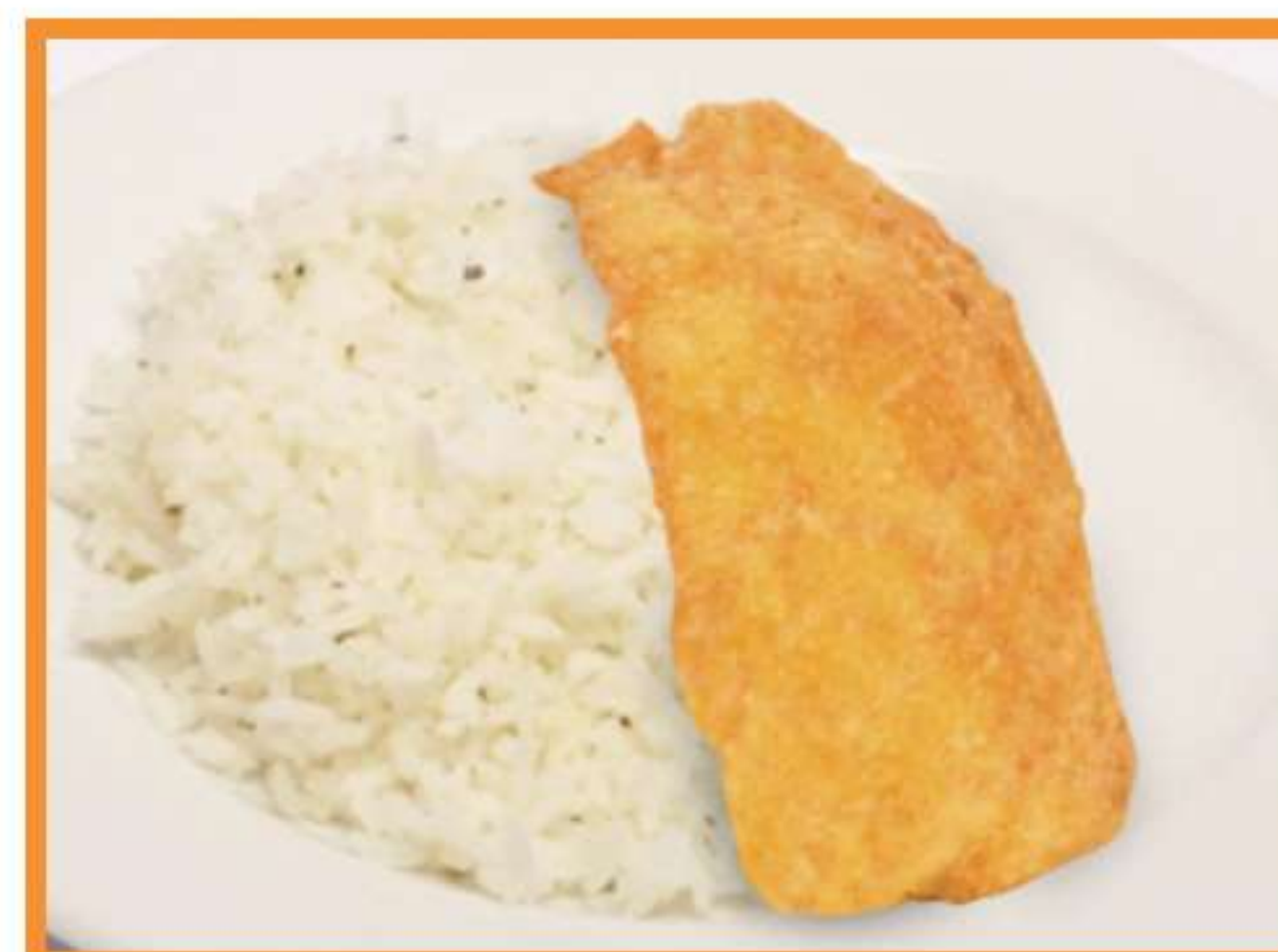
Croqueta de pescado apanado con arroz pilaf