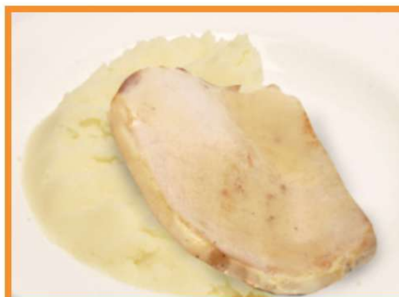
Asado de lomo de cerdo con puré de papas