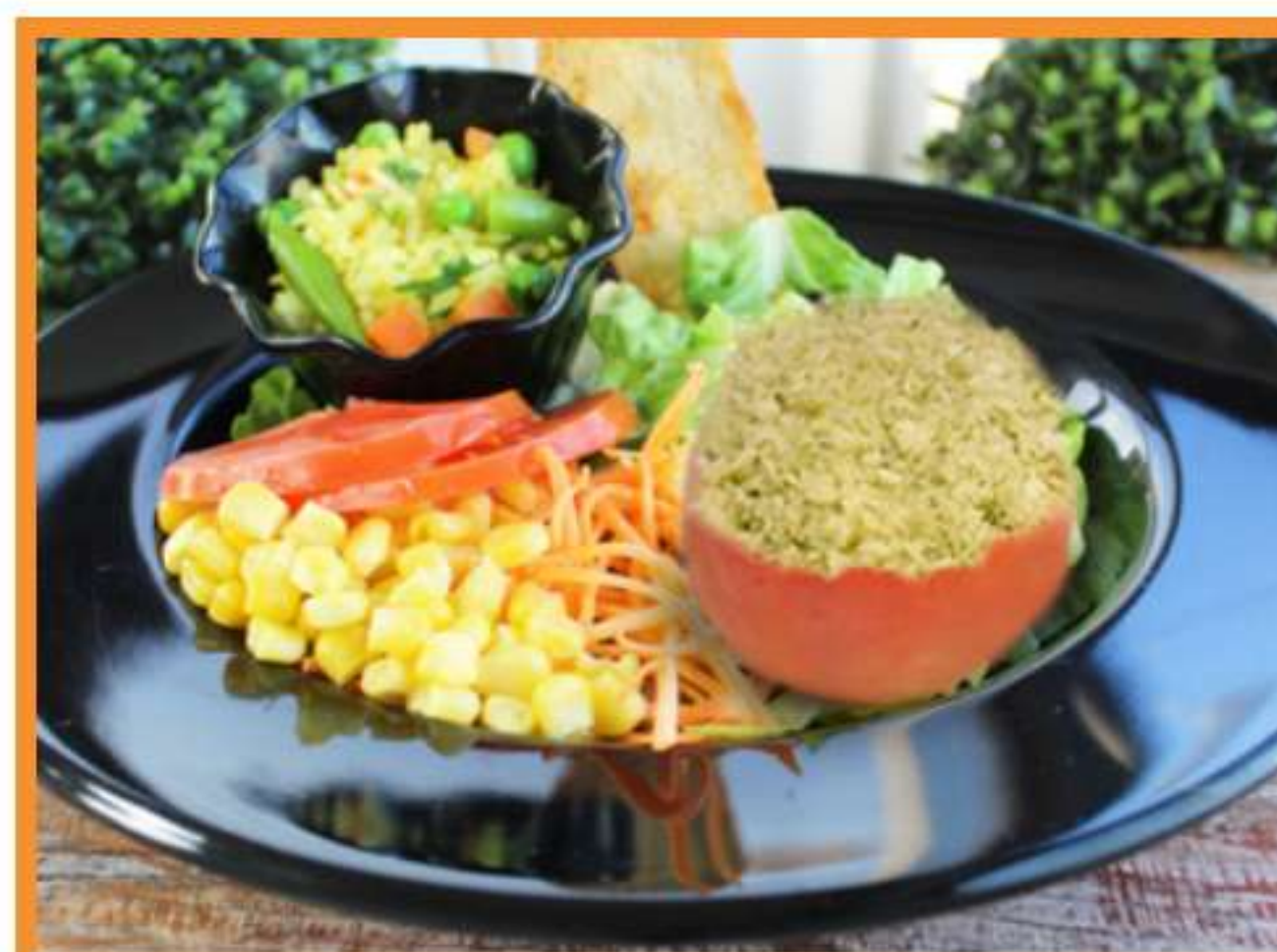
Tomate relleno con taboulette de quínoa