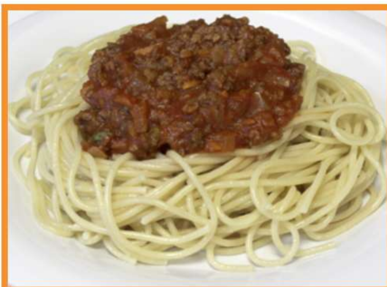
Salsa de carne con spaghetti