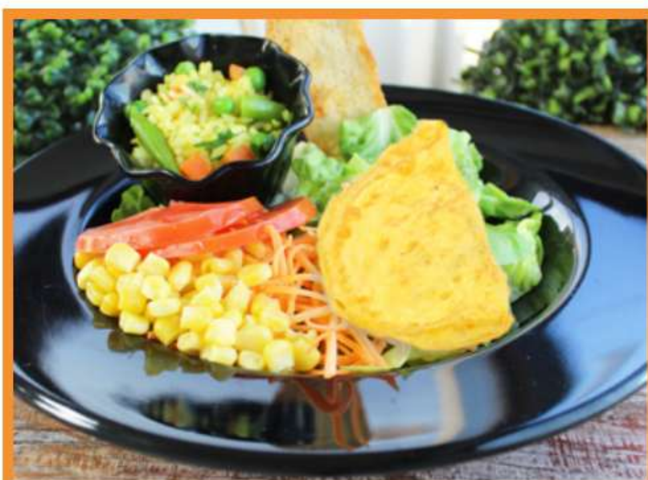
Omelette de champiñón