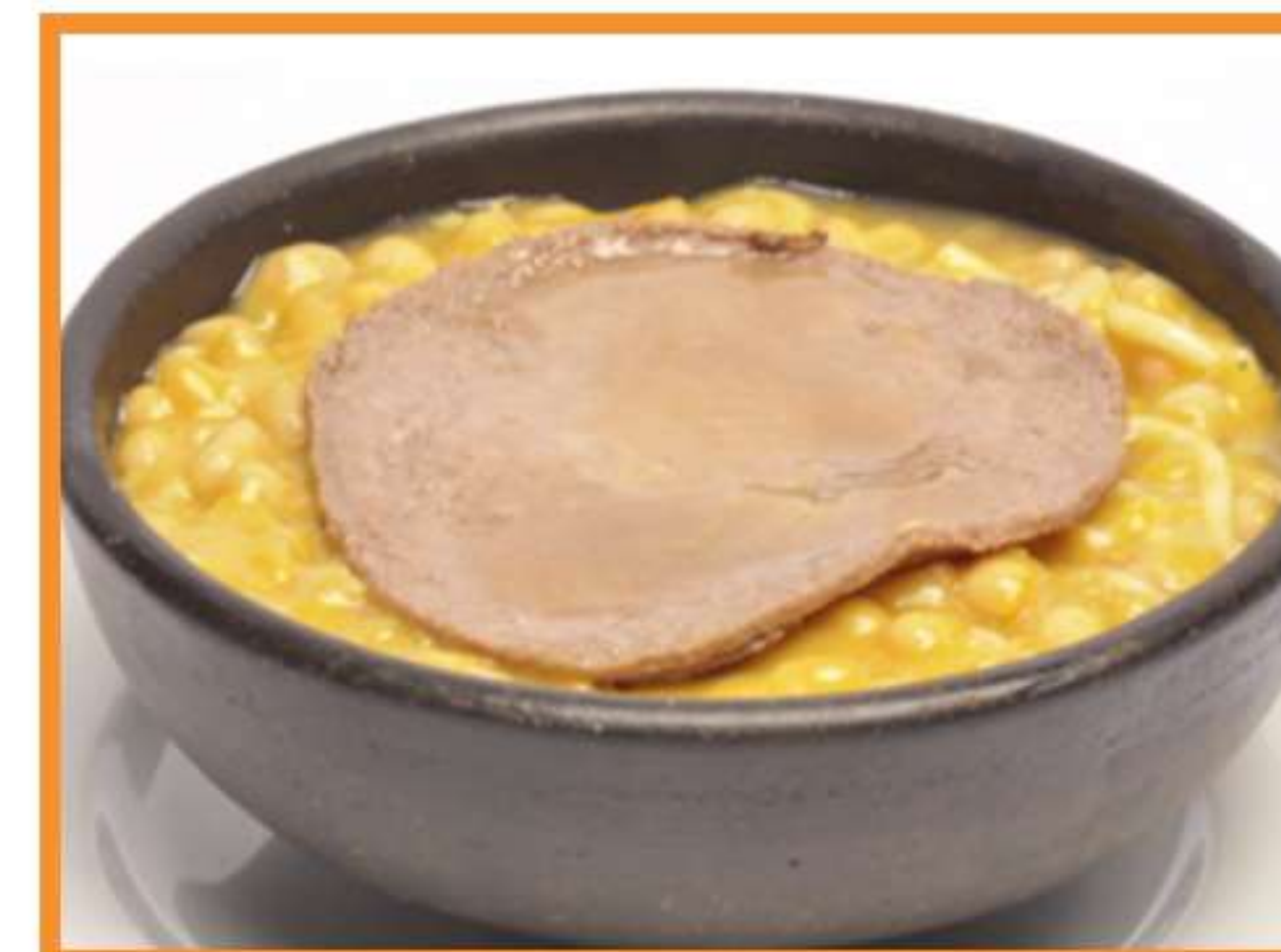
Porotos con tallarines y churrasco de vacuno