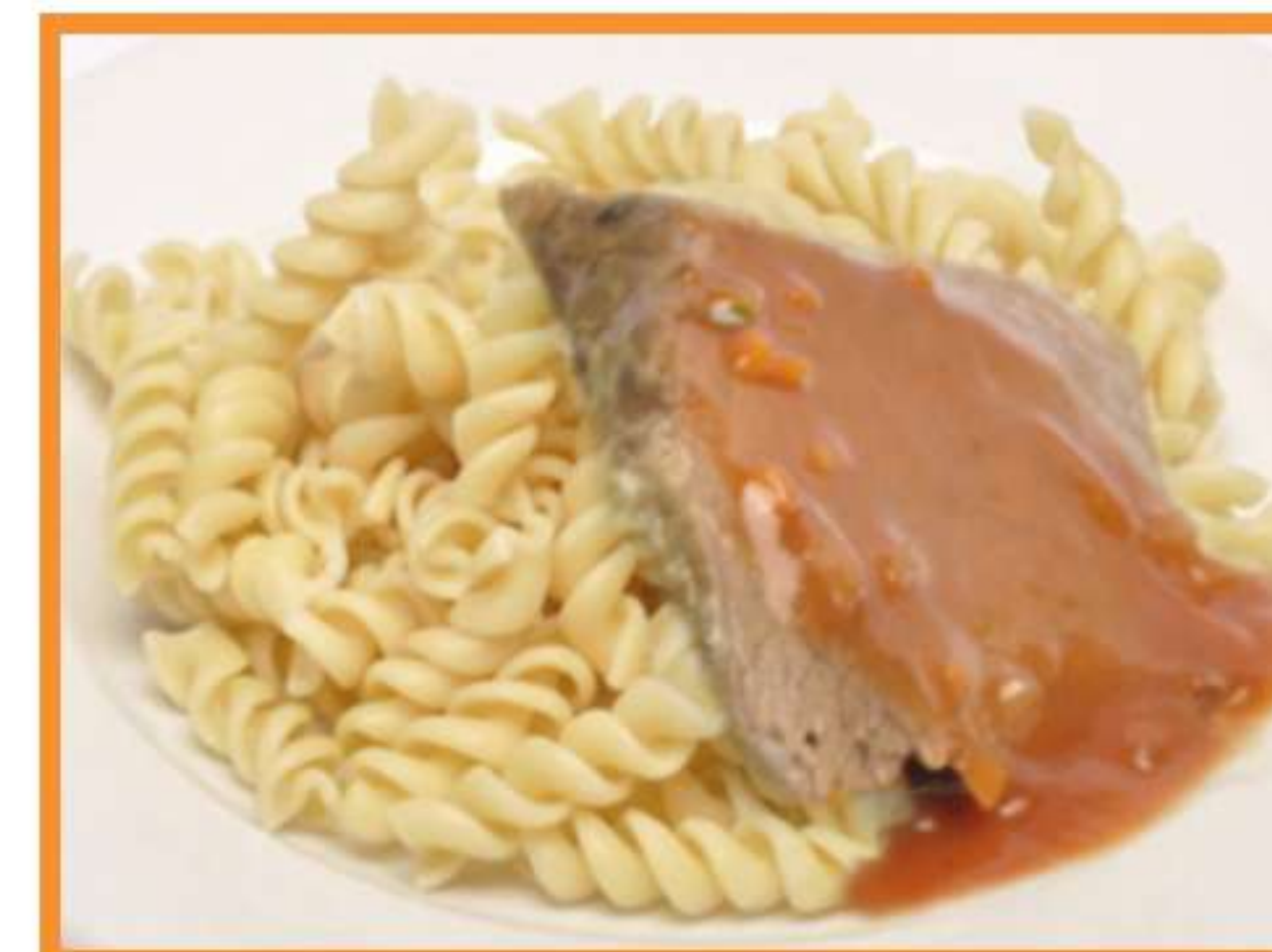
Carne al pomodoro con espirales