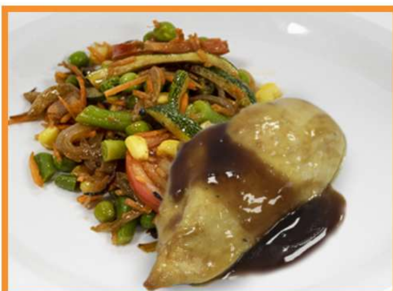
Pechuga de pollo en salsa bbq con verduras salteadas