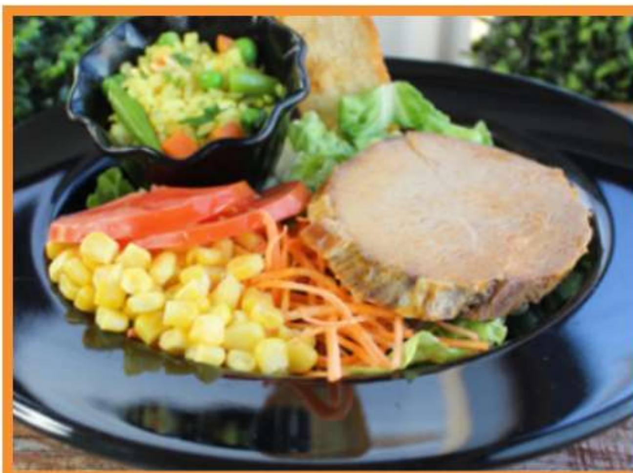
Carne al ajillo