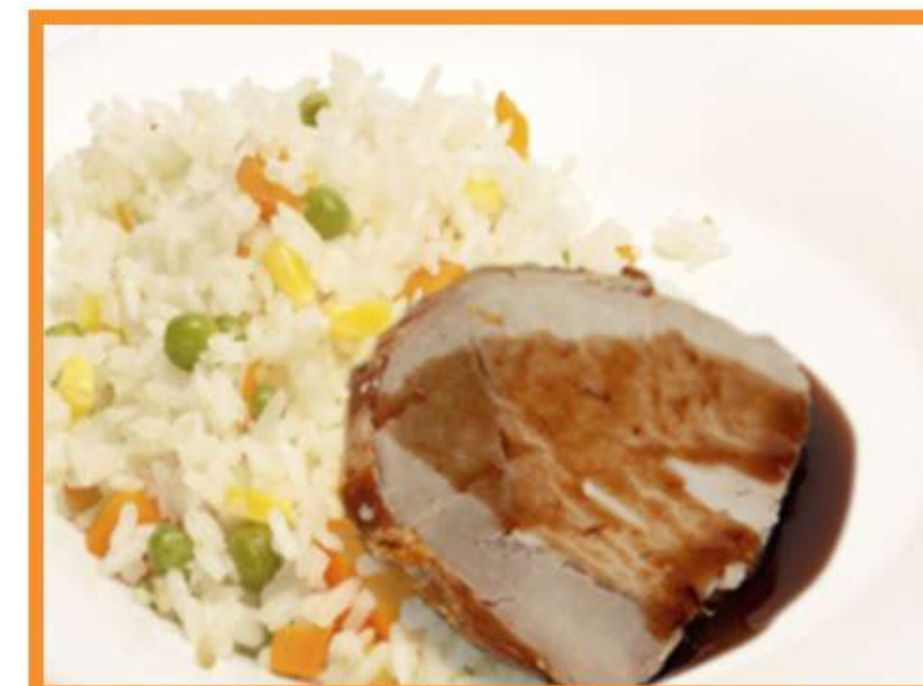
Cerdo a la bbq con arroz primavera