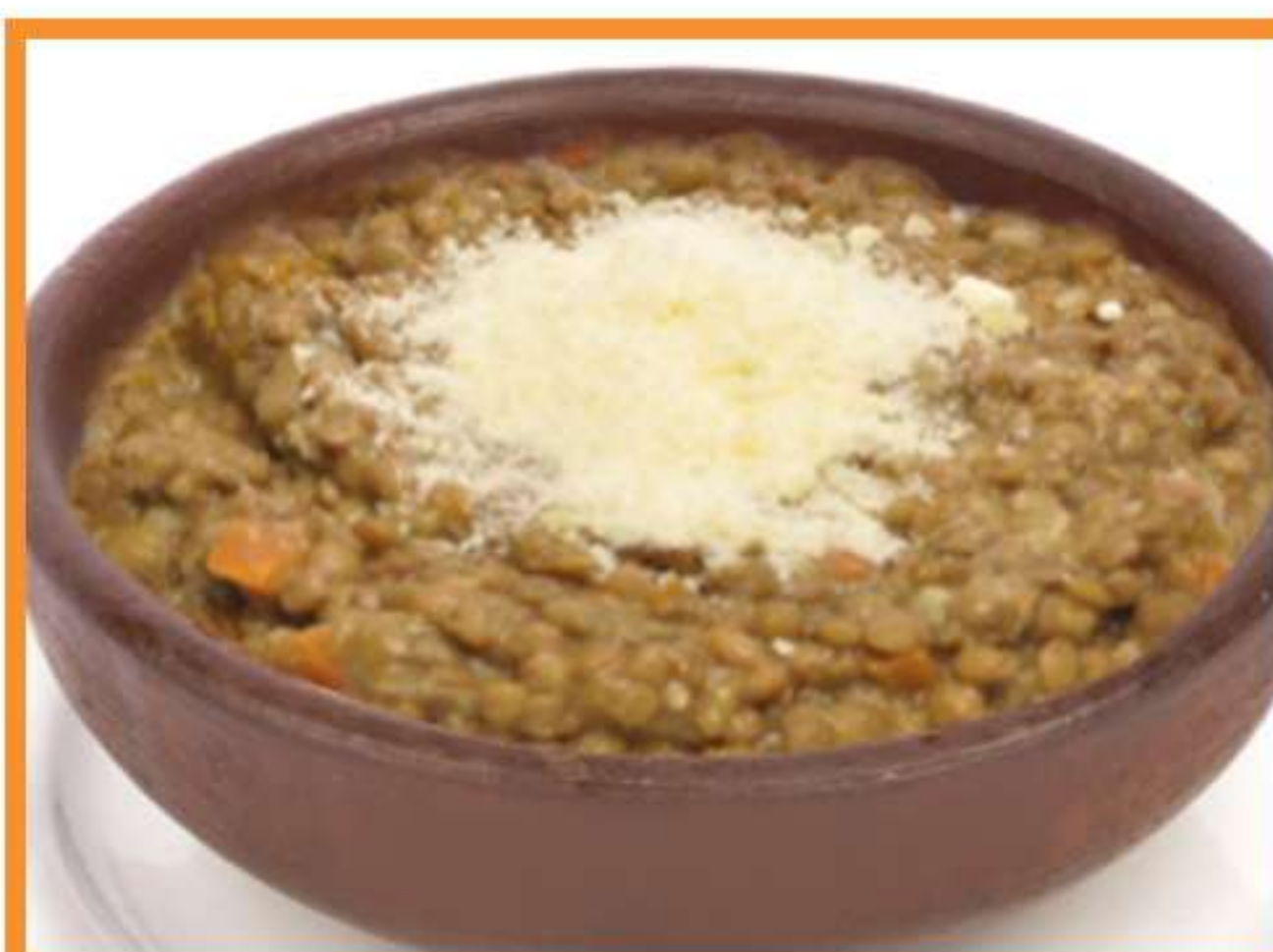
Lentejas a la parrmesana