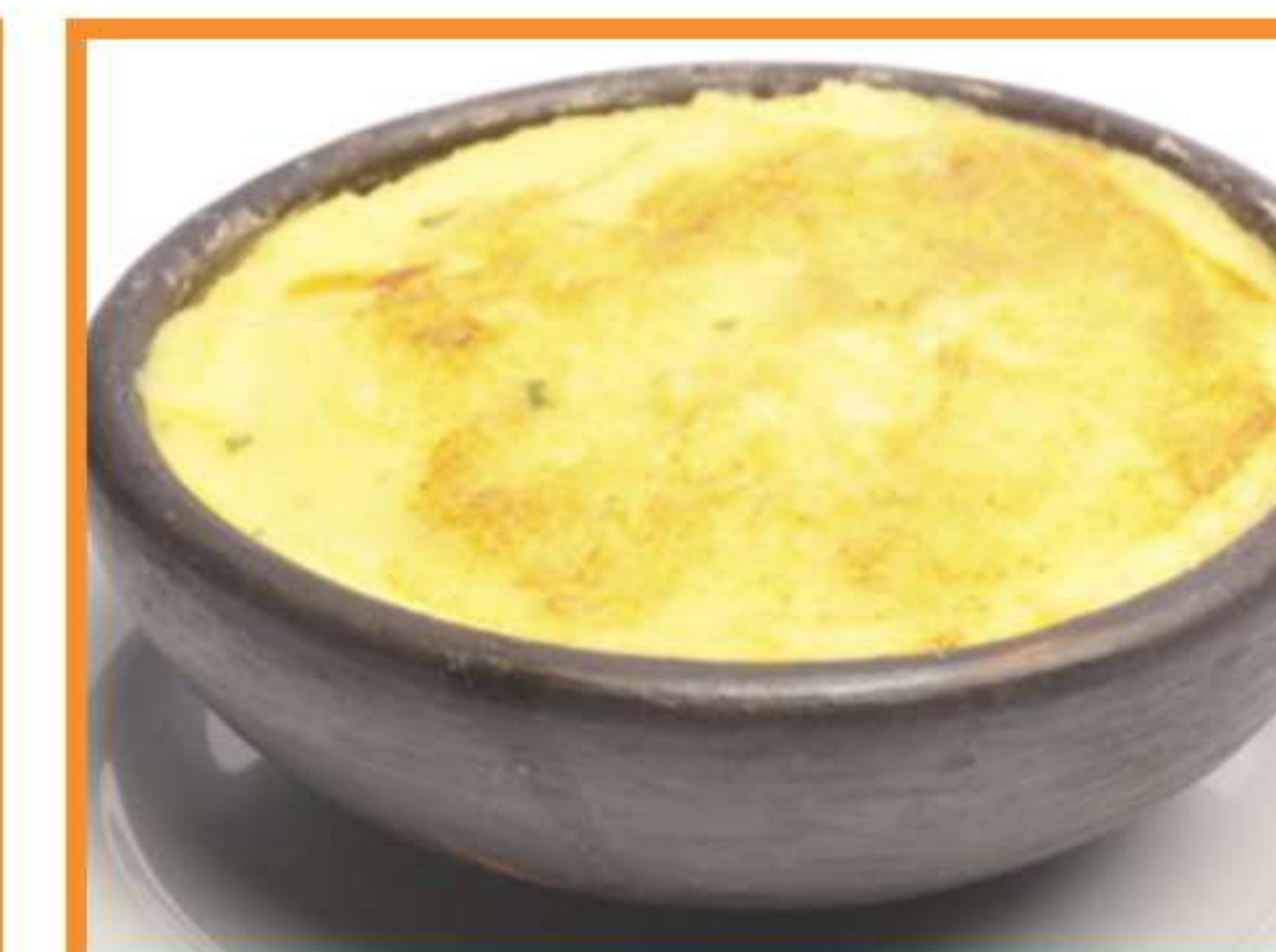
Pastel de choclo