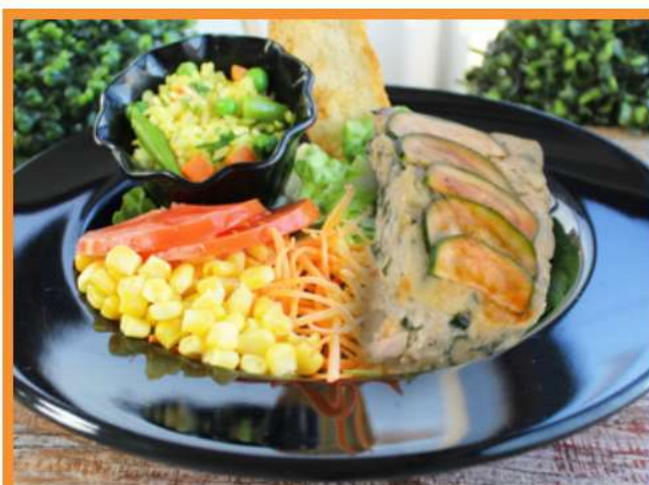
Budín de zapallito italiano