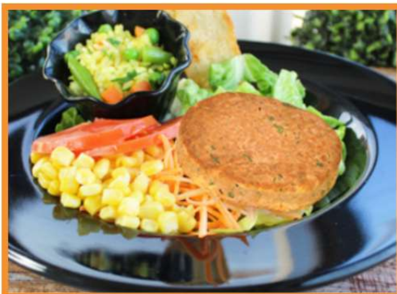
Croqueta de atún