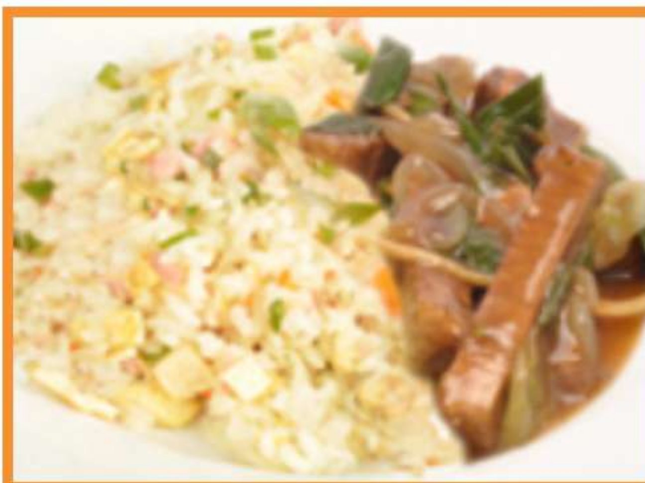
Carne mongoliana con arroz chau fan