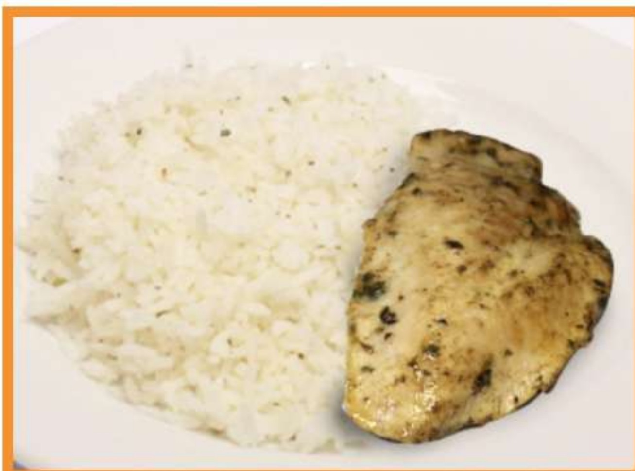
Pollo grillé con arroz pilaf