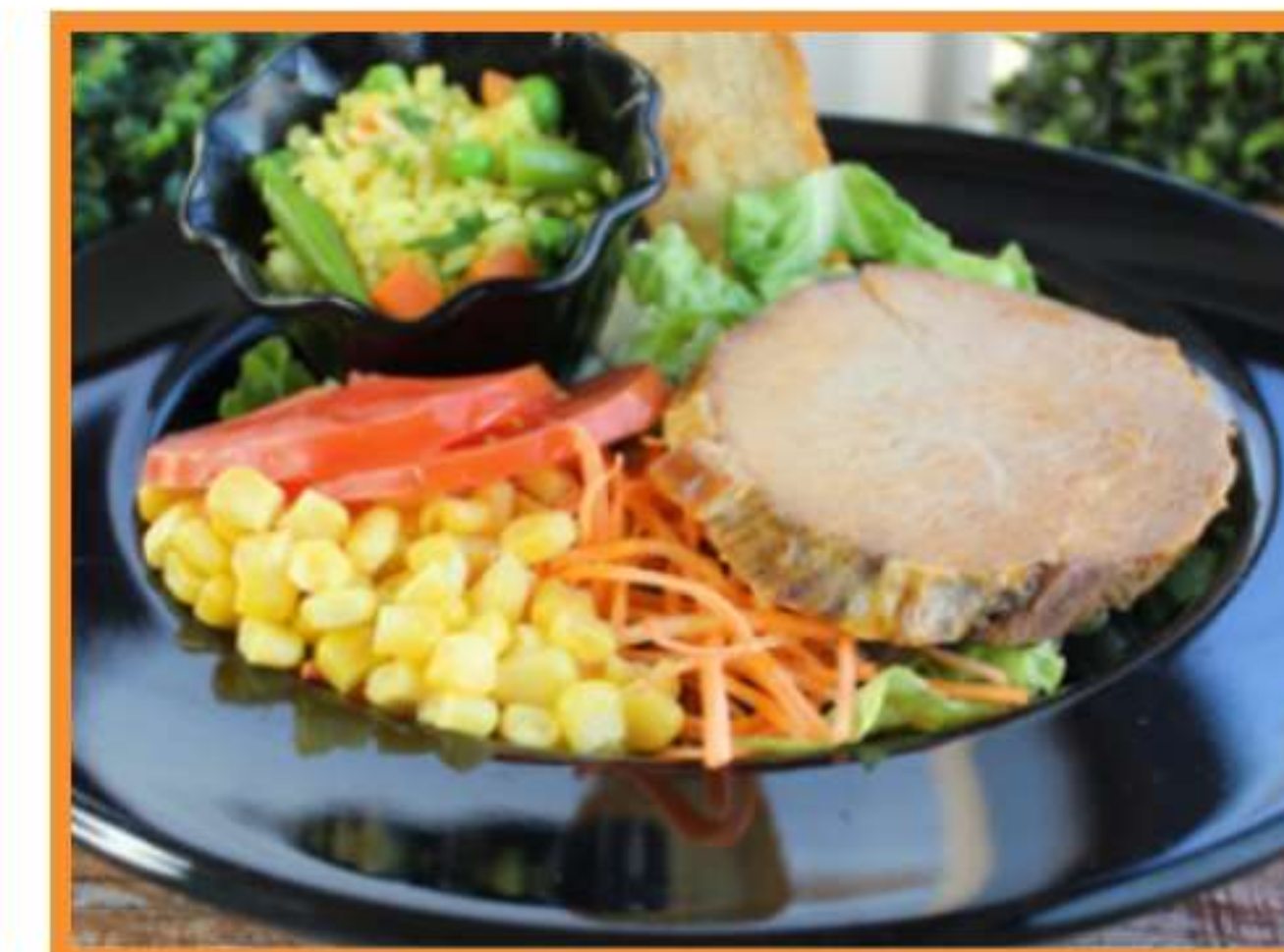
Asado de vacuno