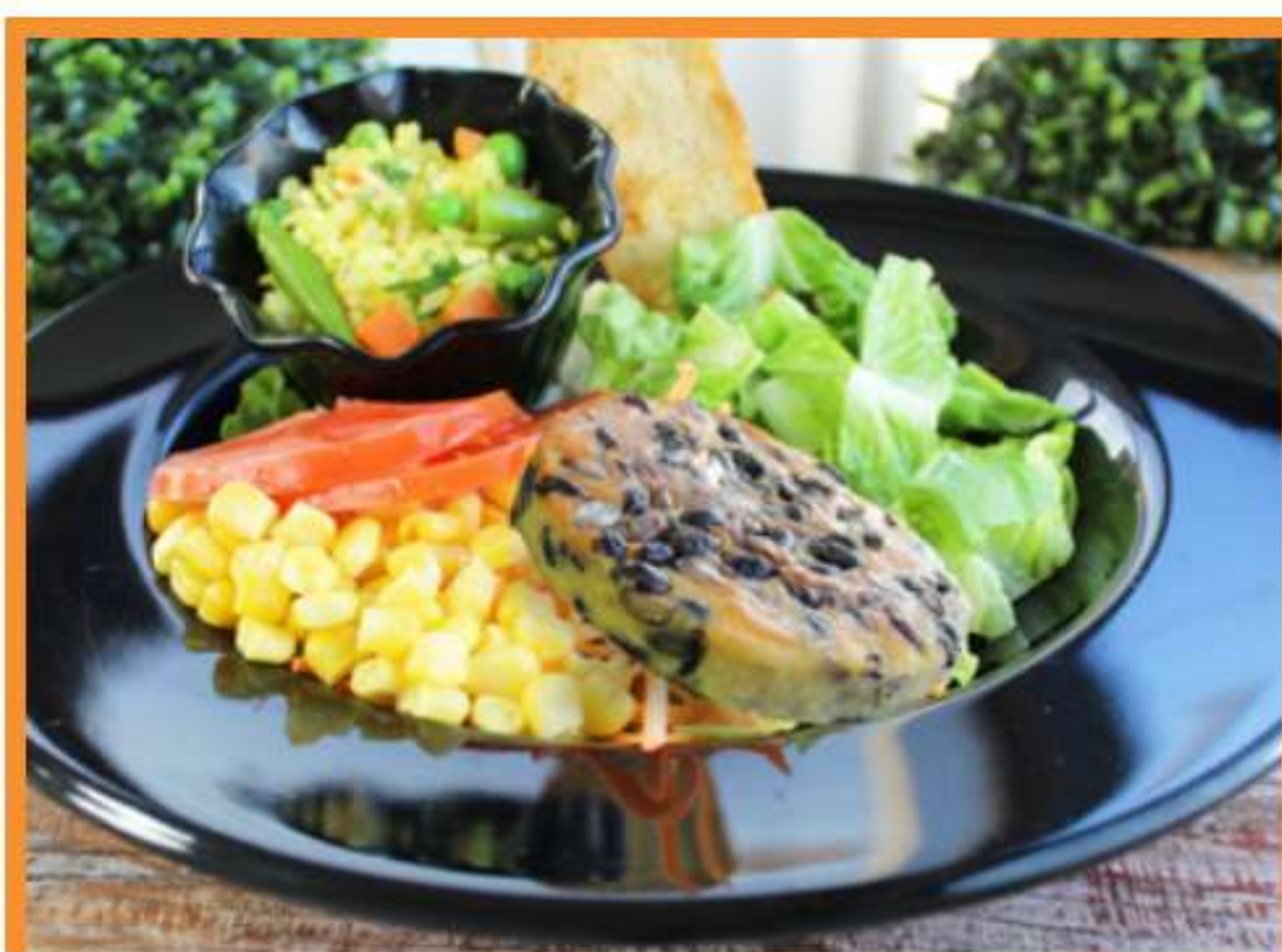
Ensalada con hamburguesa de poroto