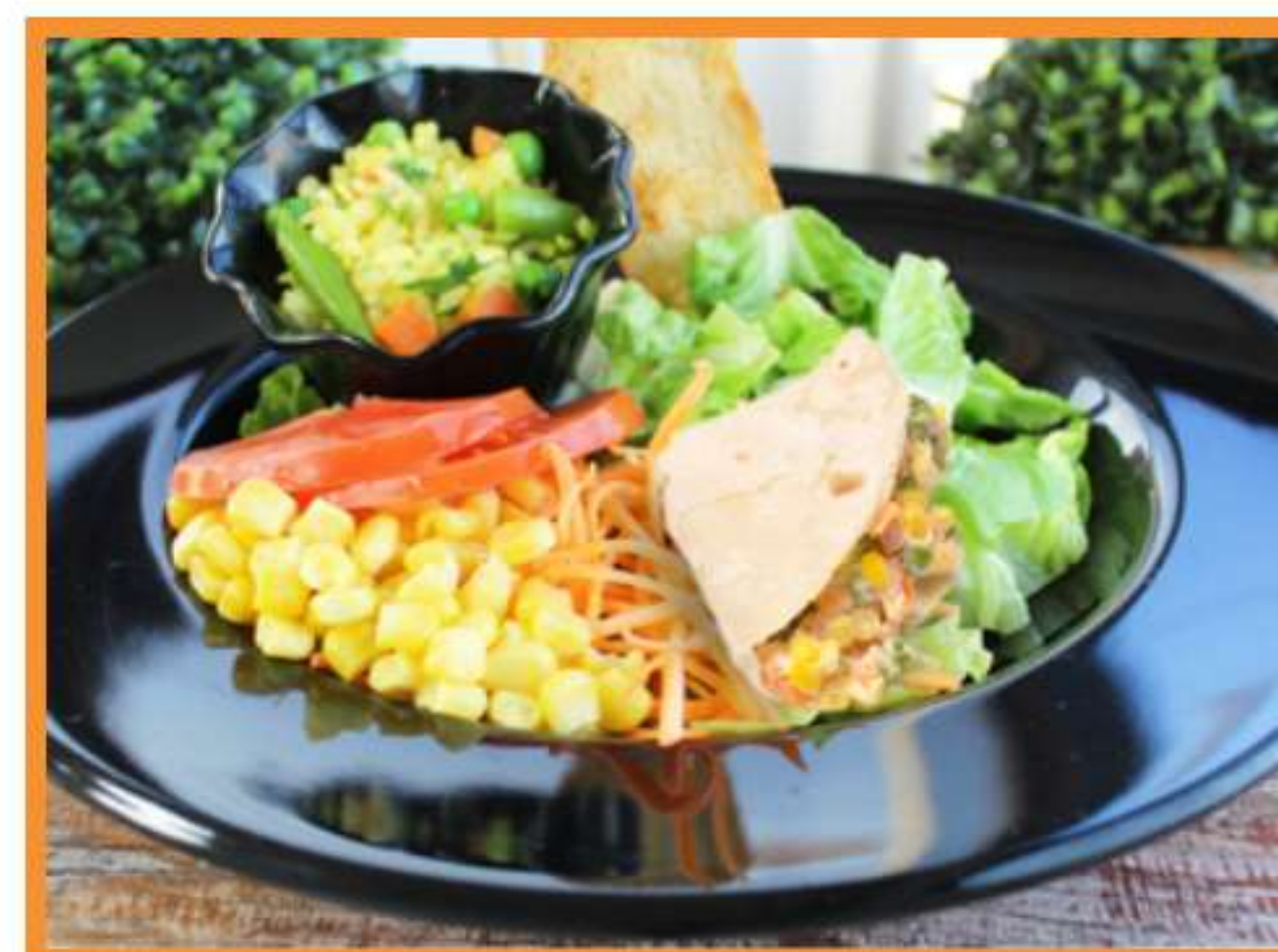
Panqueque de verduras orientales