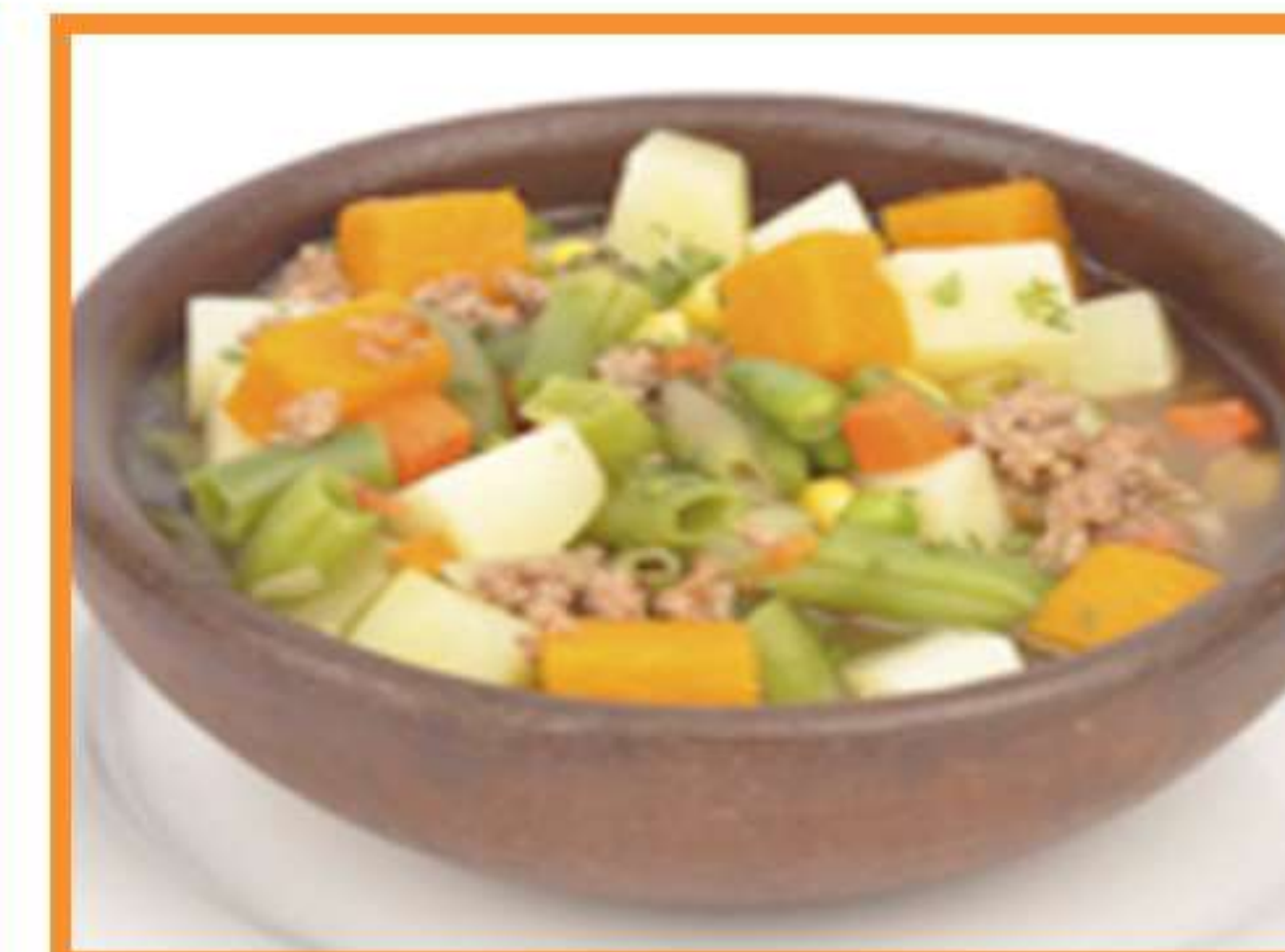
Carbonada de vacuno