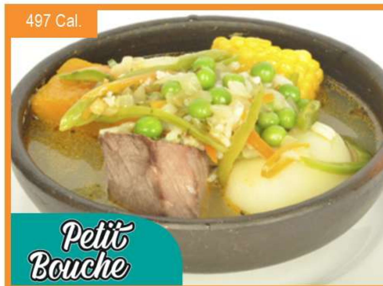
Cazuela de vacuno