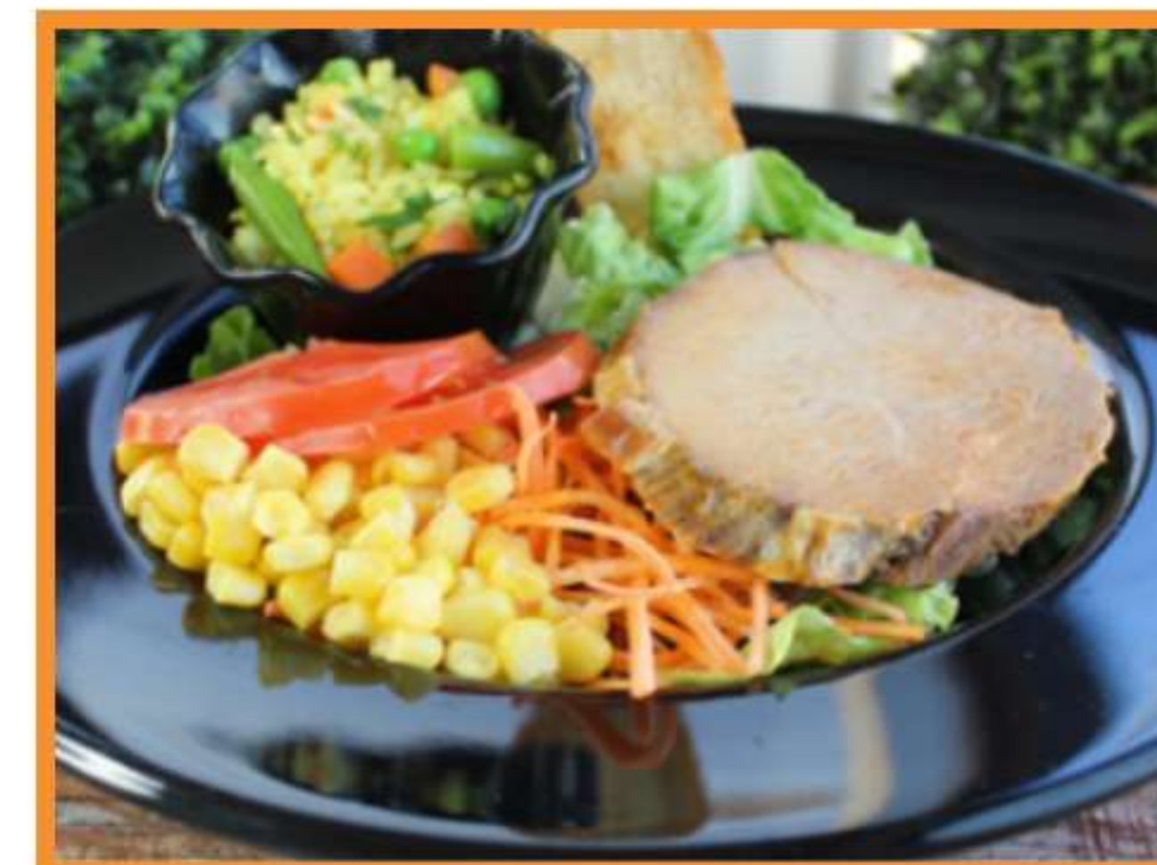
Asado de vacuno