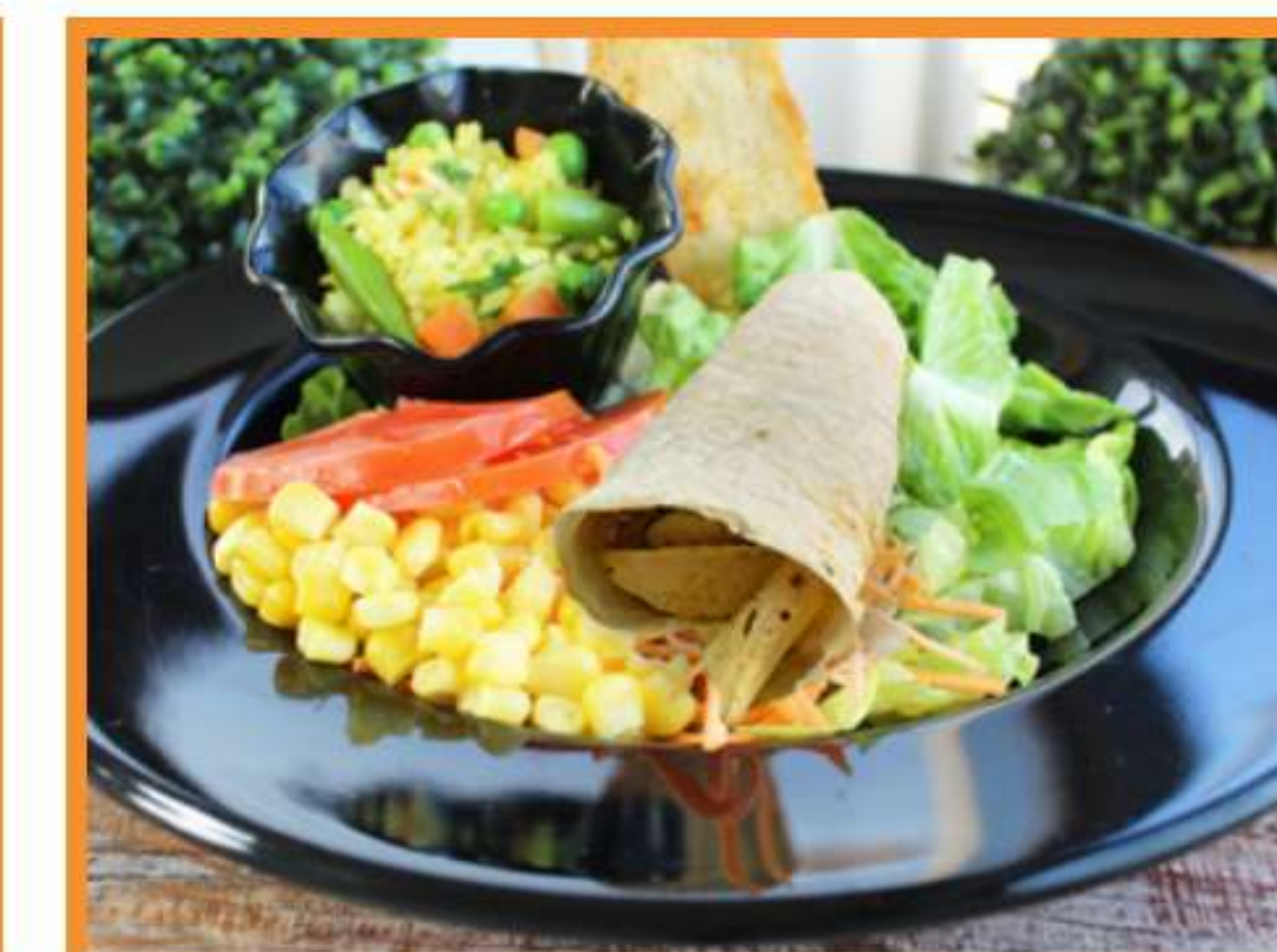
Flauta del huerto