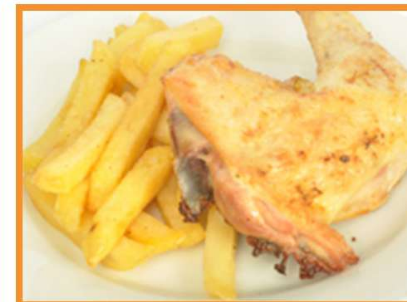
Trutro de pollo asado con papas horneadas