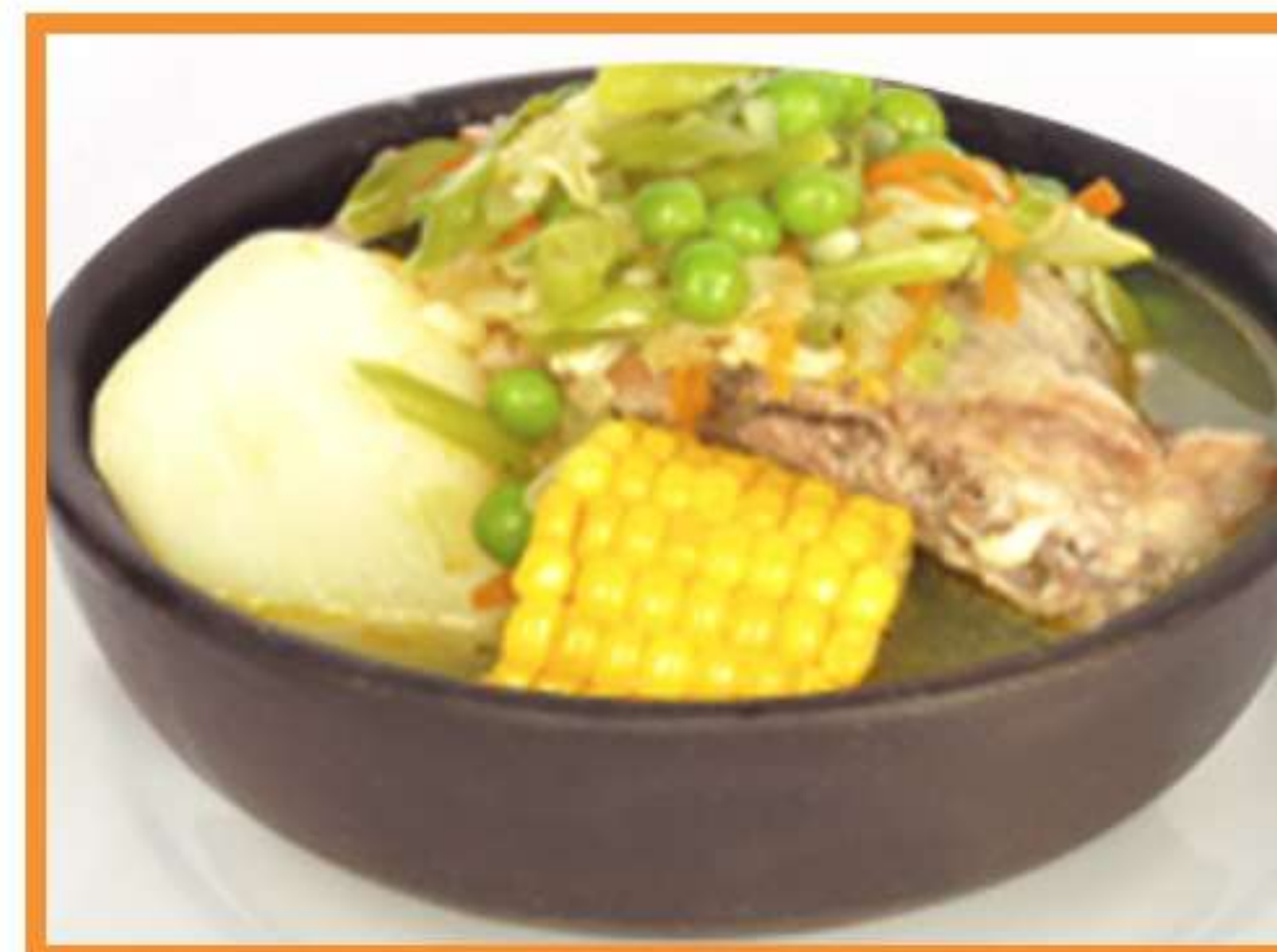
Cazuela de ave