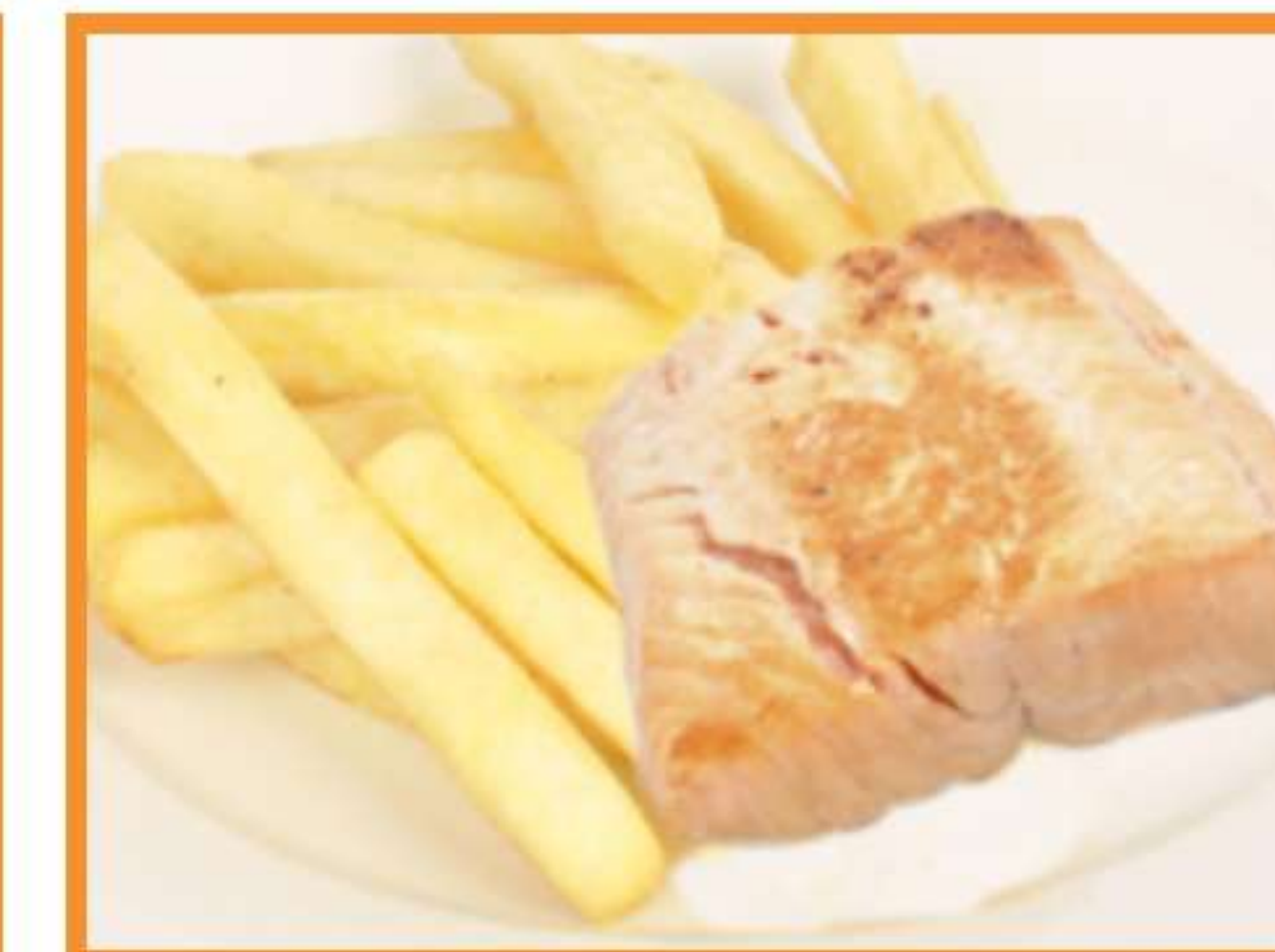
Salmón a la grilla con papas horneadas