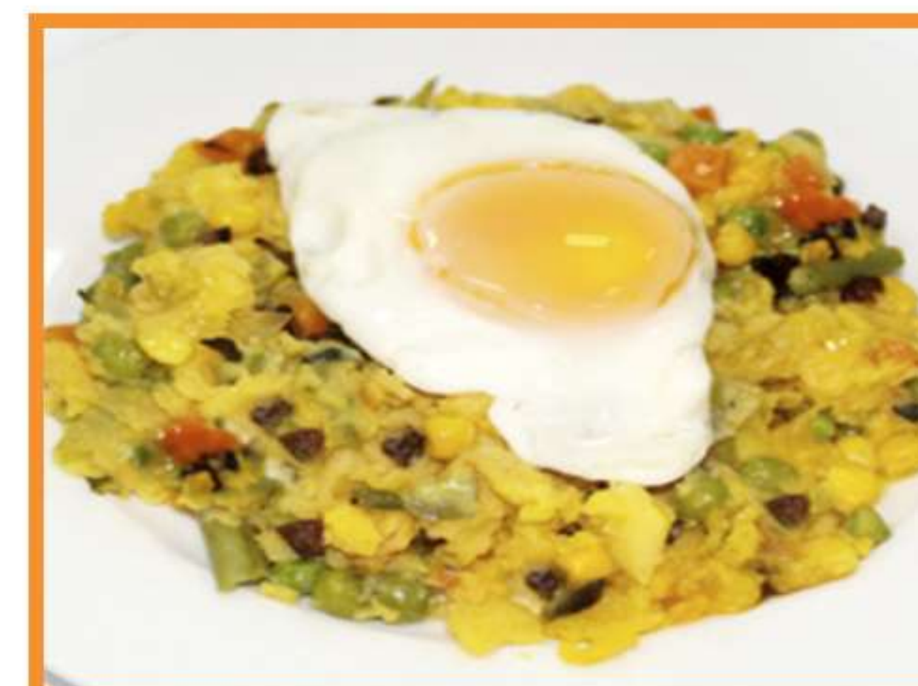
Charquicán de carne con huevo frito