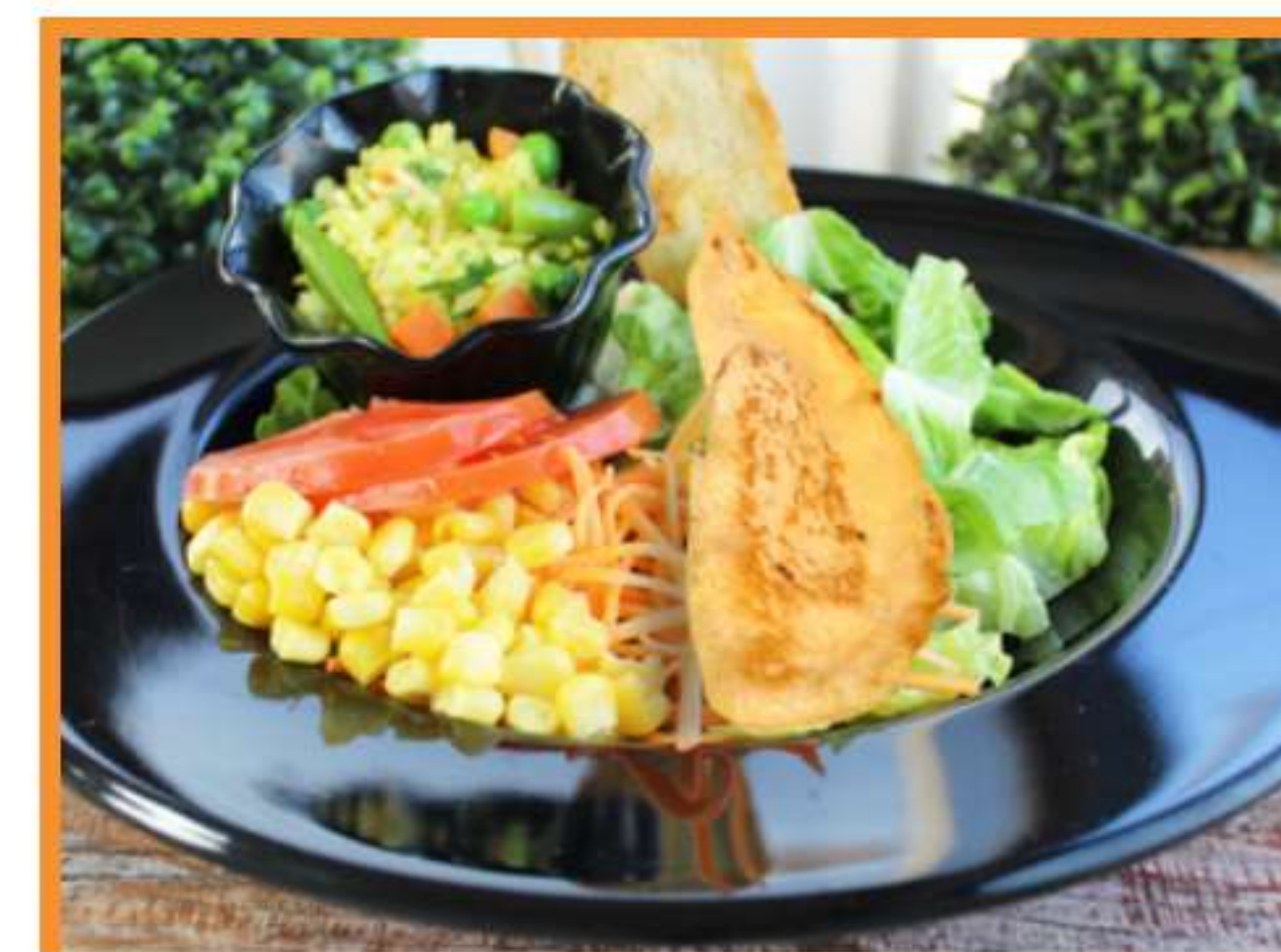
Omelette zanahoria aceituna