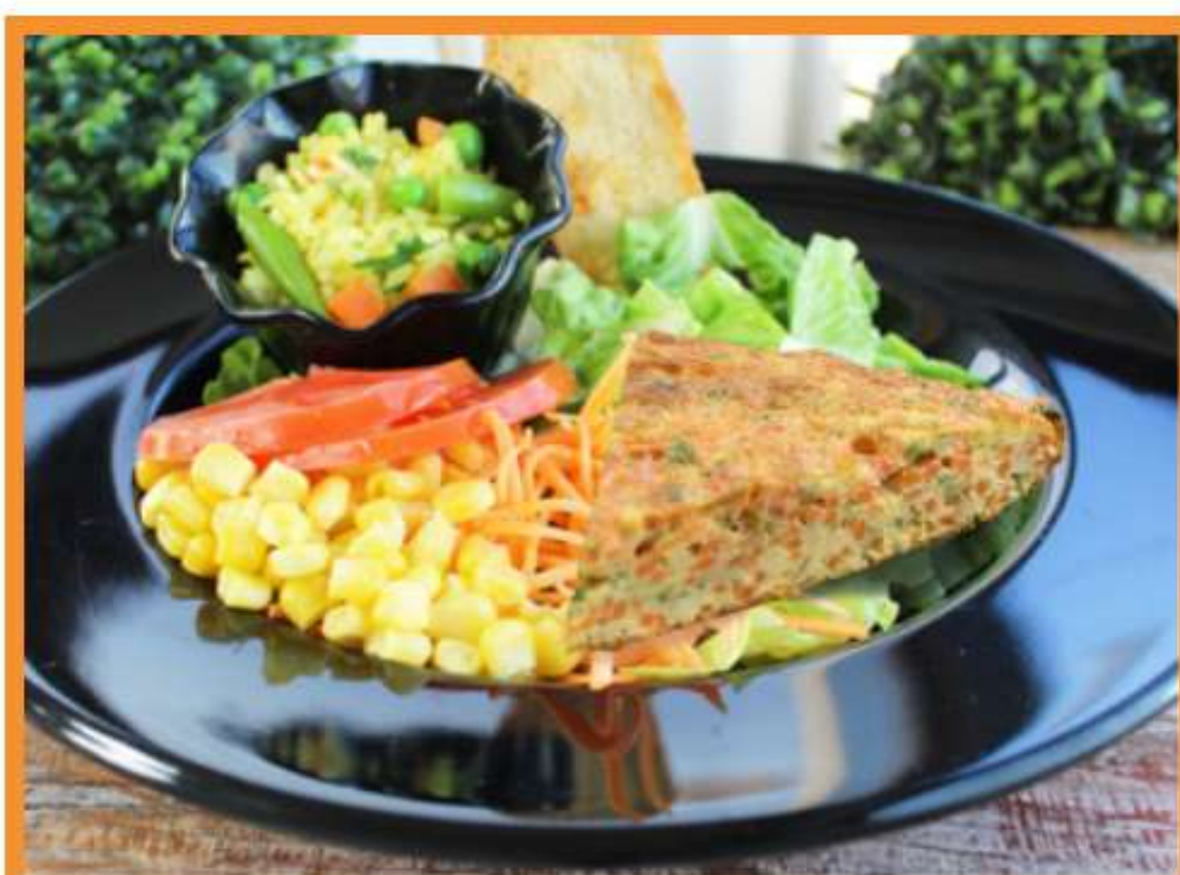
Tortilla de verduras