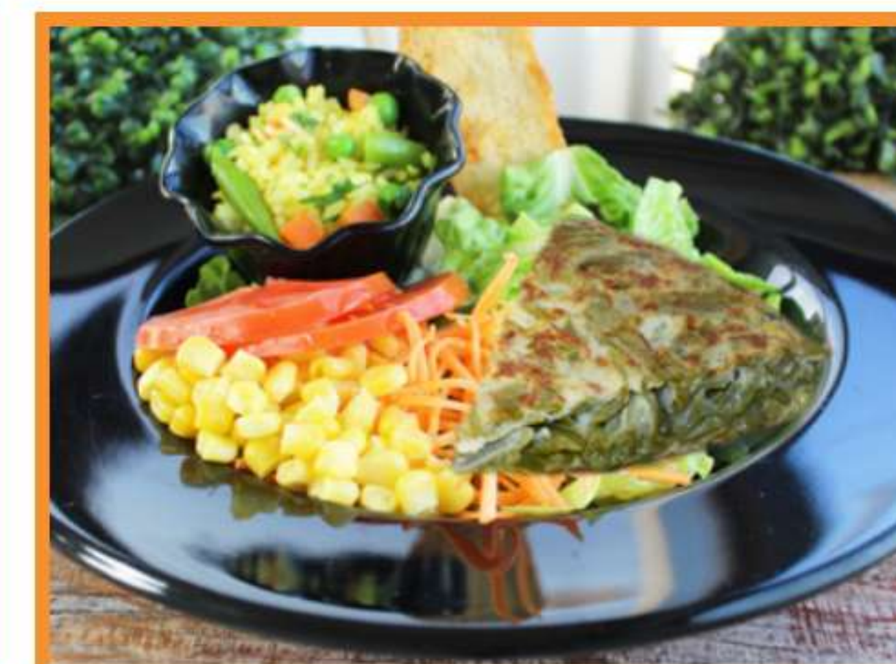
Tortilla de porotos verdes (al horno)