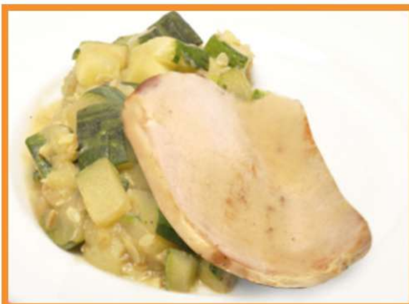
Asado de cerdo con guiso de zapallo italiano