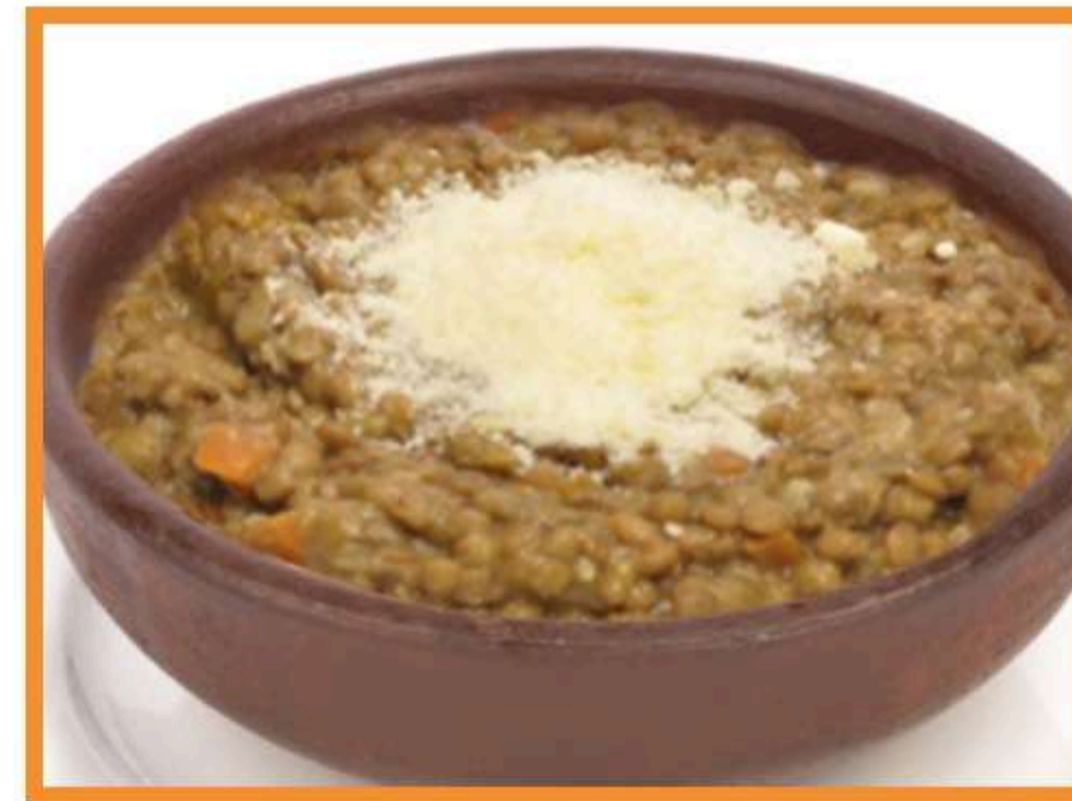
Lentejas a la pamesana