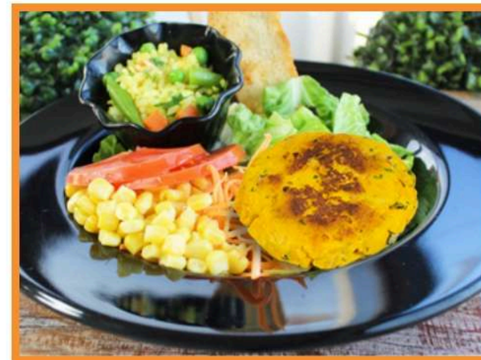
Croqueta de hummus gratinada