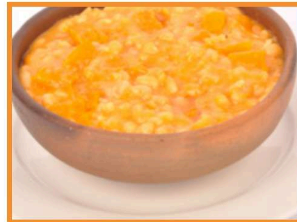
Porotos con tallarines