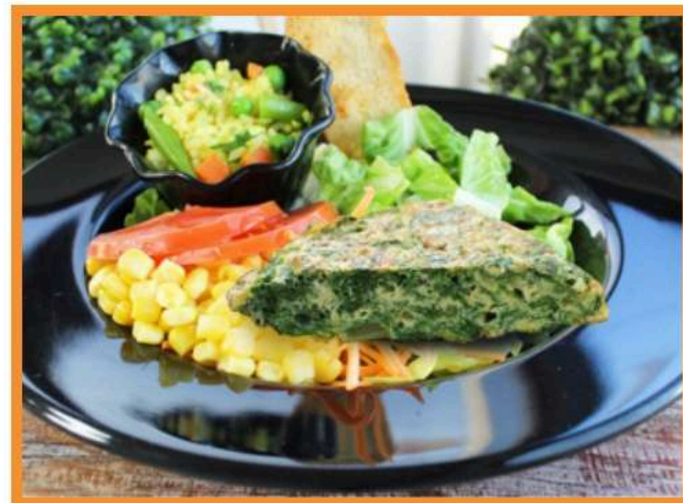
Tortilla de acelgas