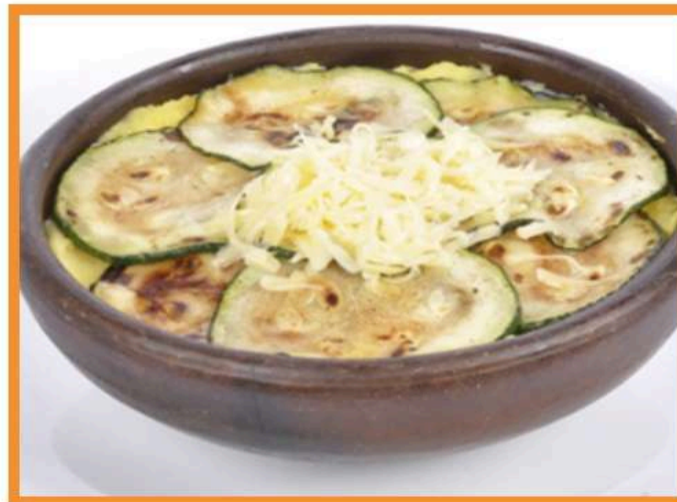
Pastel de zapallito italiano y papa con carne