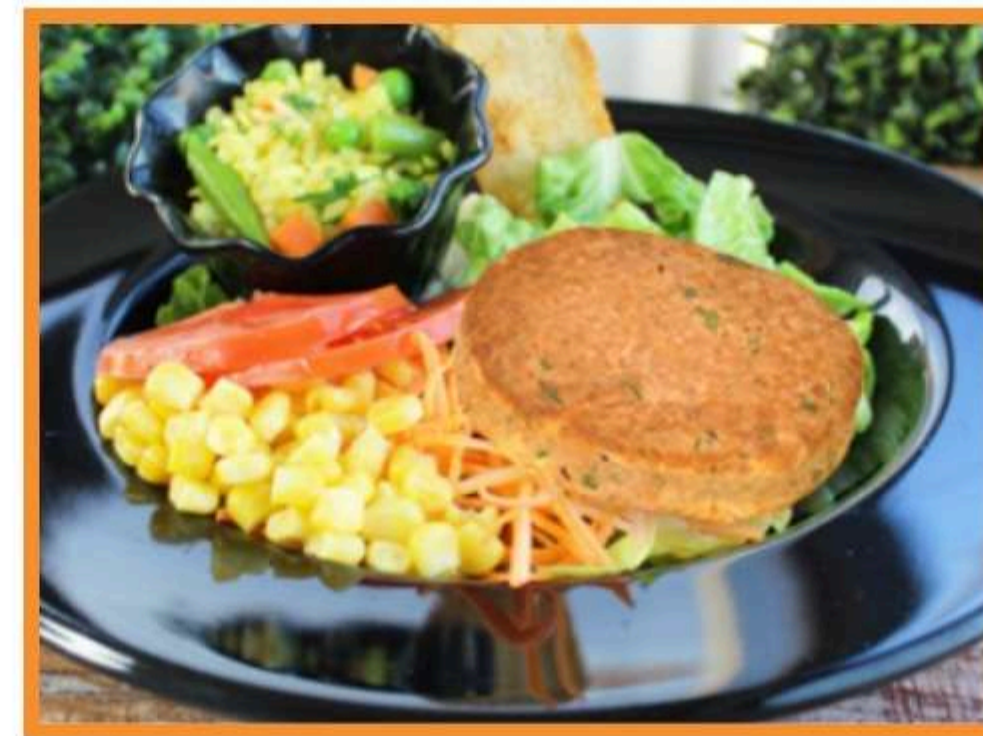
Croqueta de atún