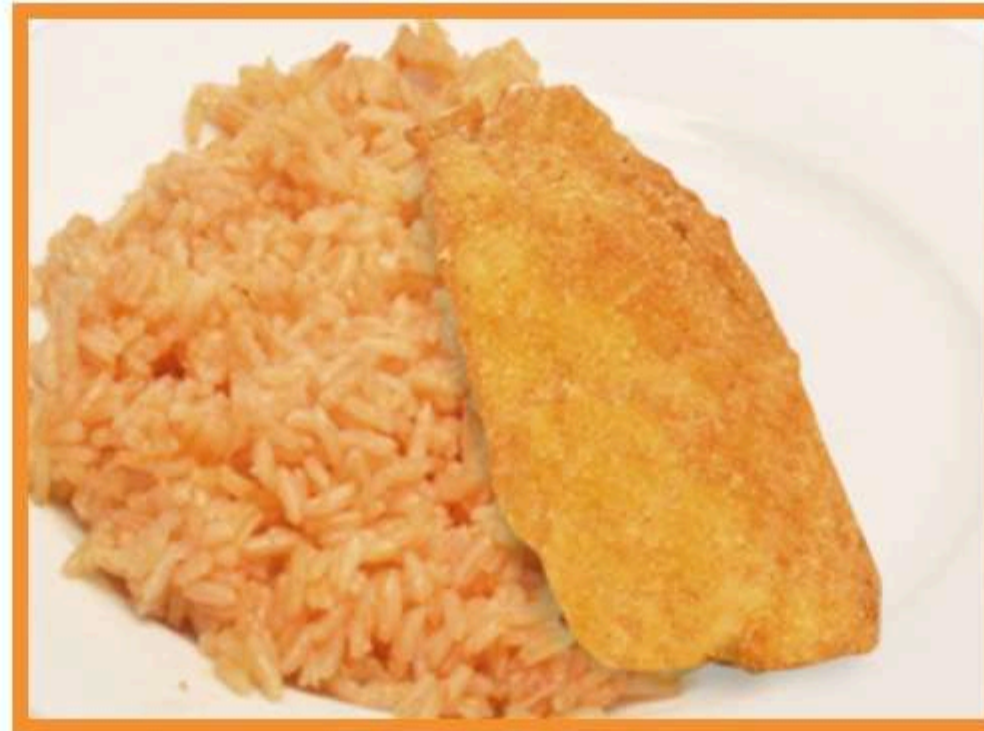
Pescado apanado con arroz al tomate