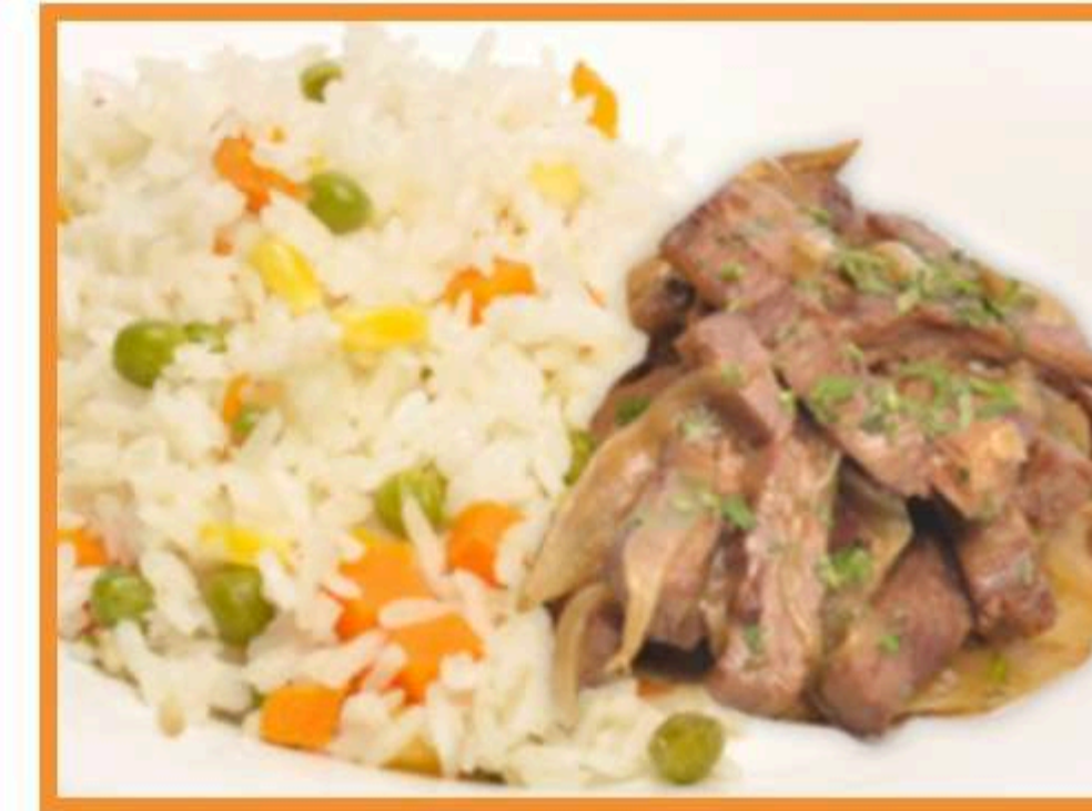
Salteado de res con arroz primavera