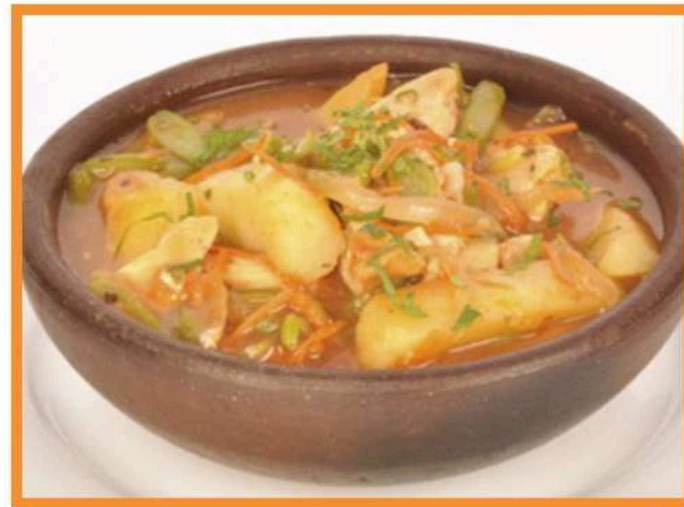
Estofado de ave