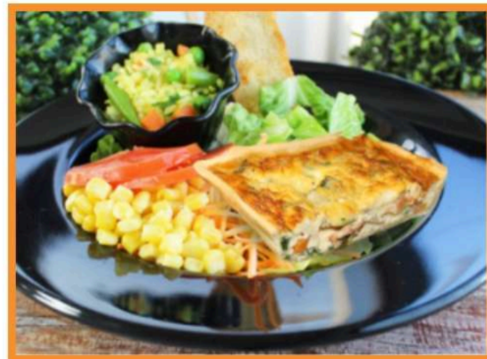
Quiche de zapallo italiano