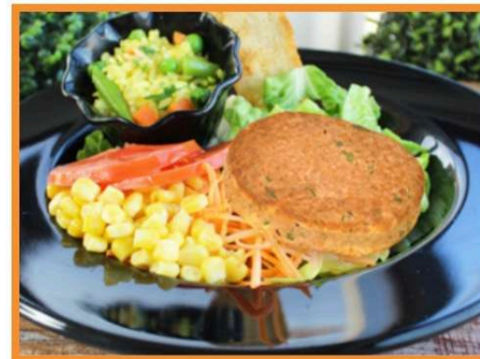
Croqueta de atún