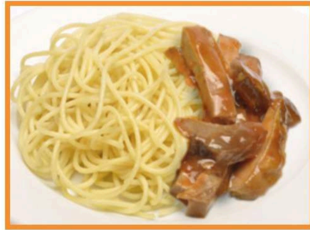
Salteado de res con spaghetti