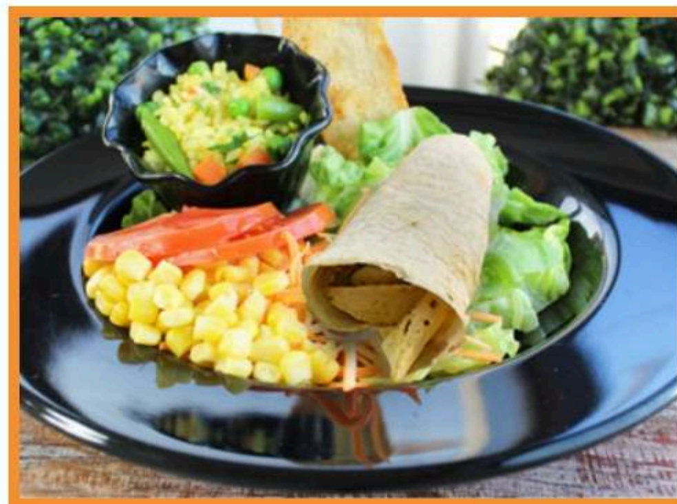
Panqueque de champiñones