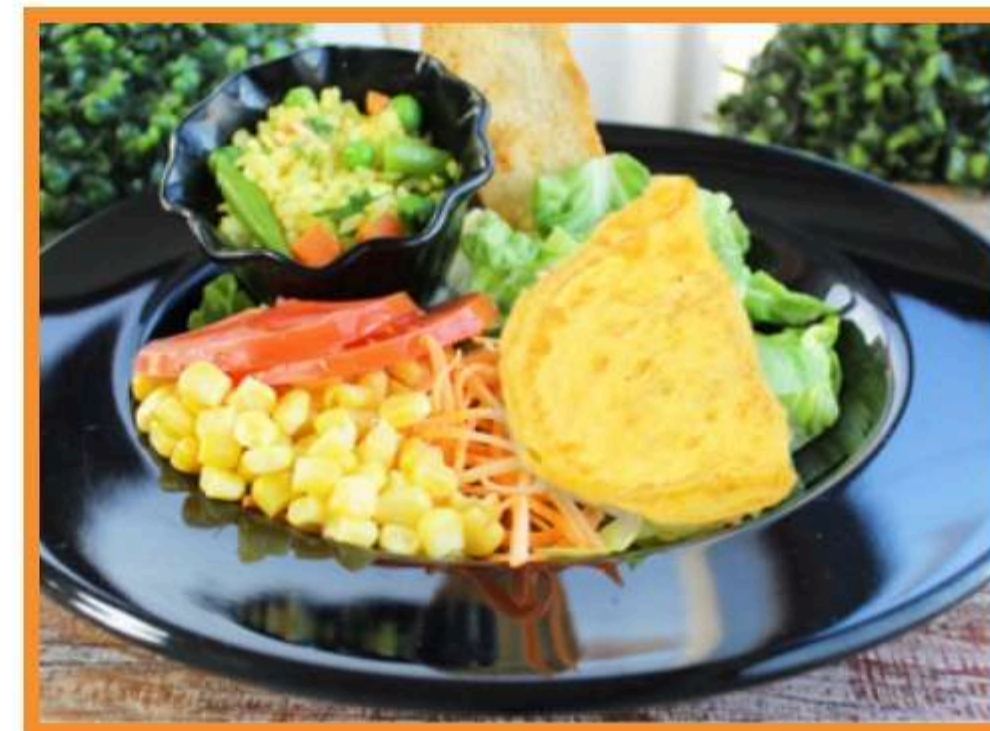
Omelette de champiñón queso