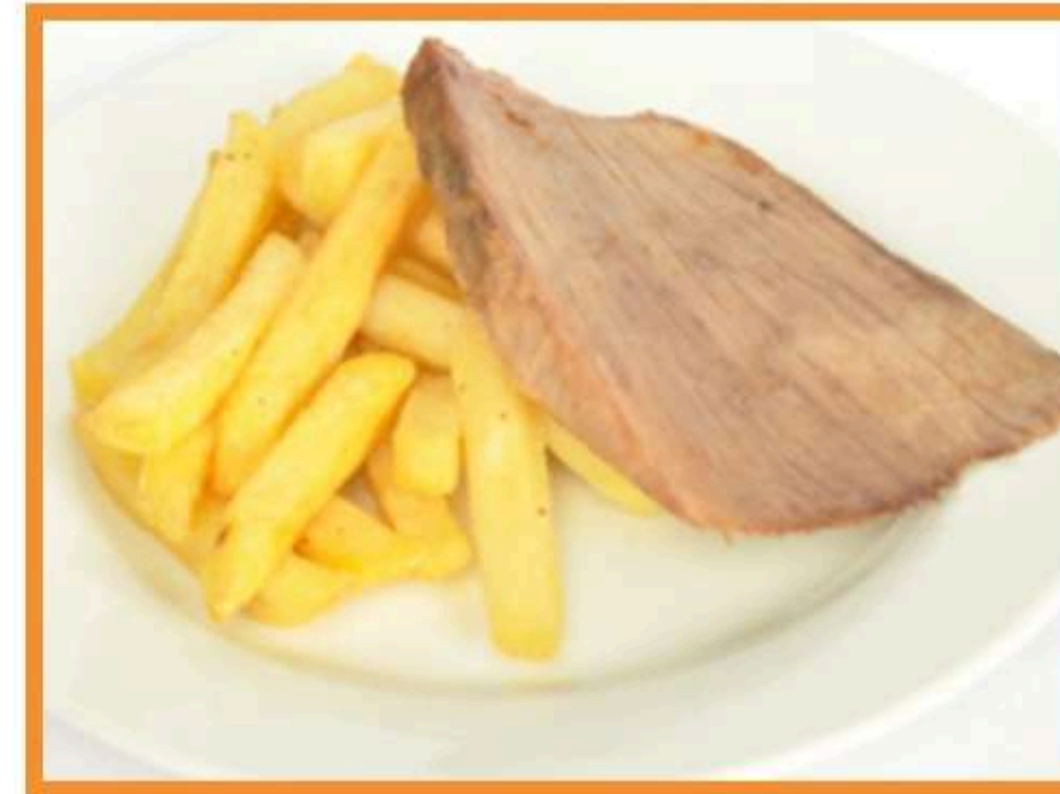
Asado al horno con papas horneadas