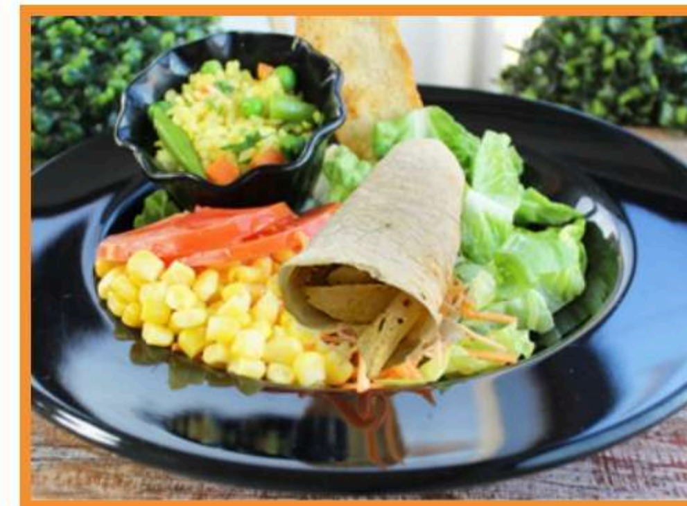
Flauta del huerto