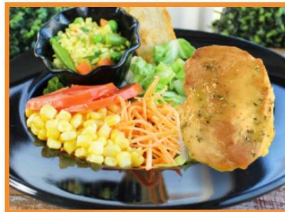
Pechuga de pollo al orégano