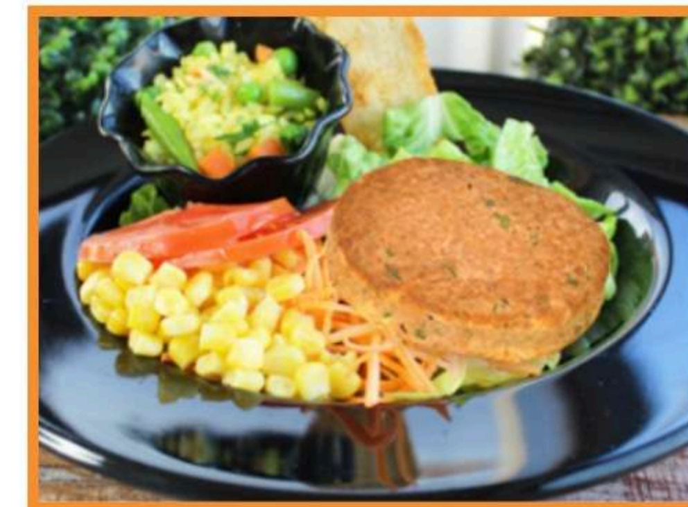
Croqueta de atún