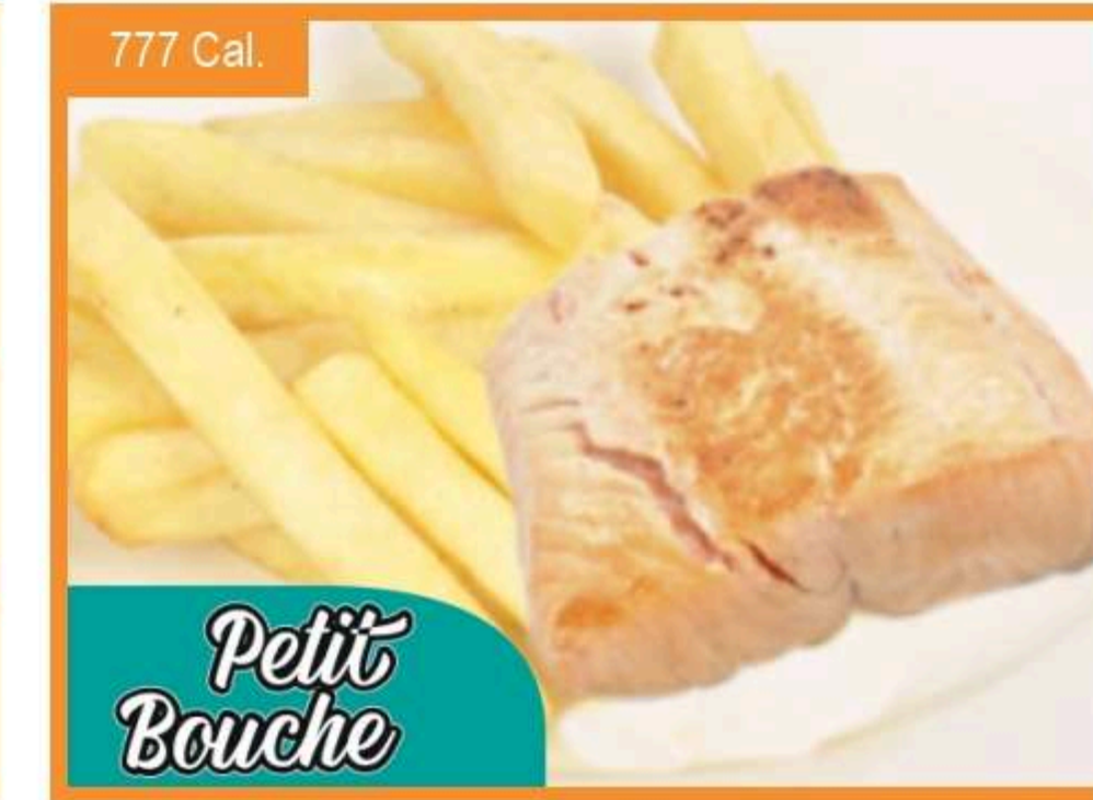
Salmón a la grilla con papas horneadas