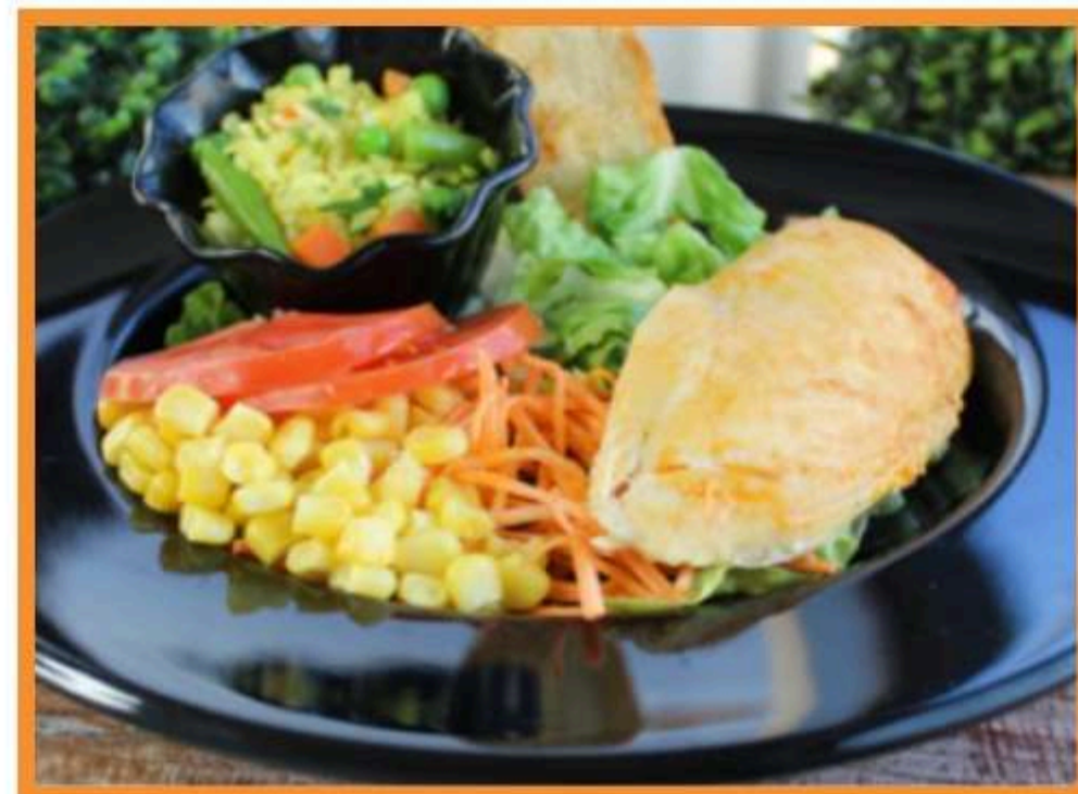
Pechuga de pollo asado