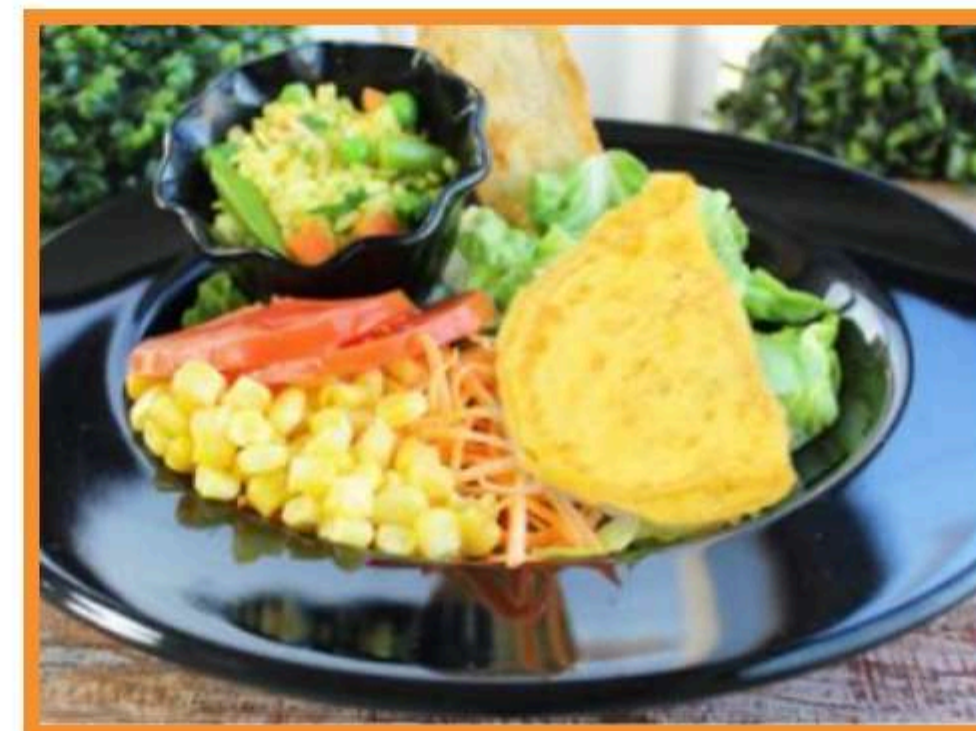
Omelette de champiñón aceituna