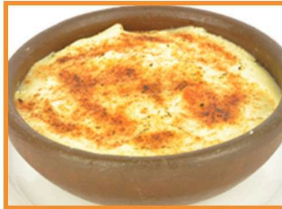
Pastel de papas