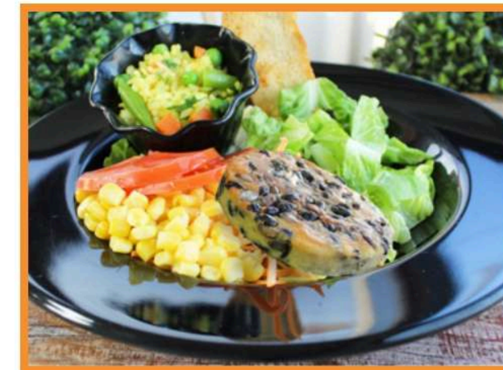
Ensalada con hamburguesa de poroto