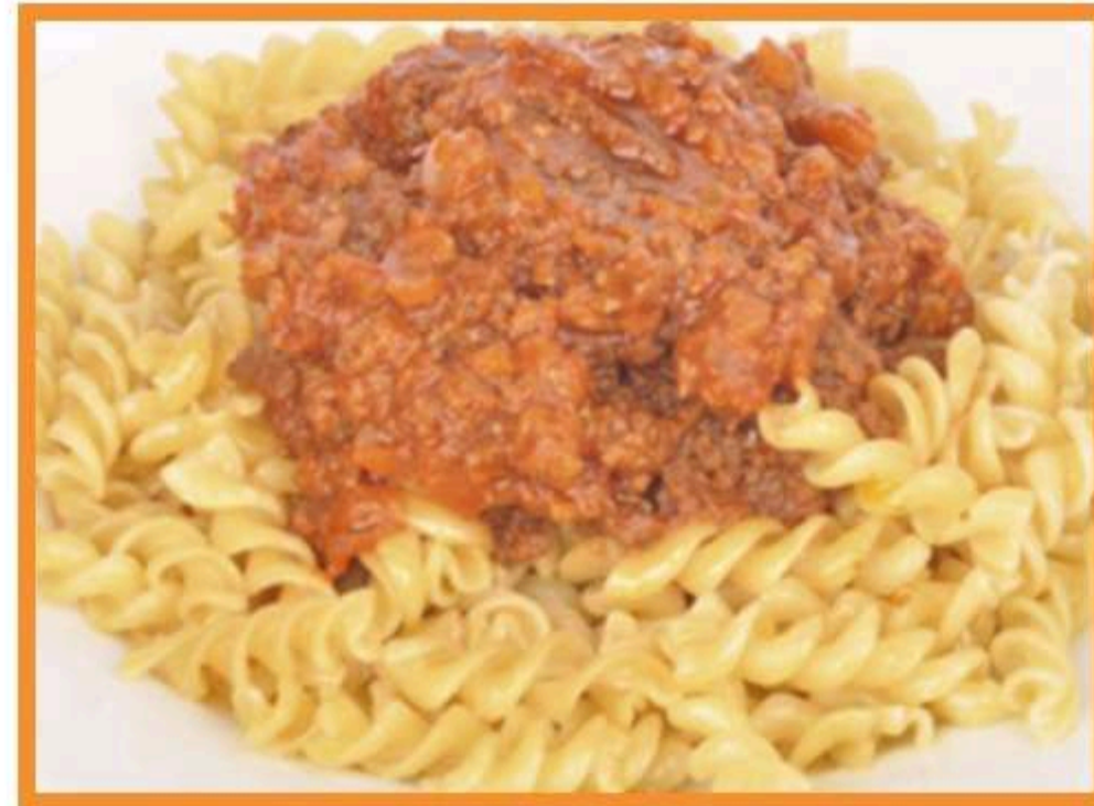
Salsa de carne con espirales