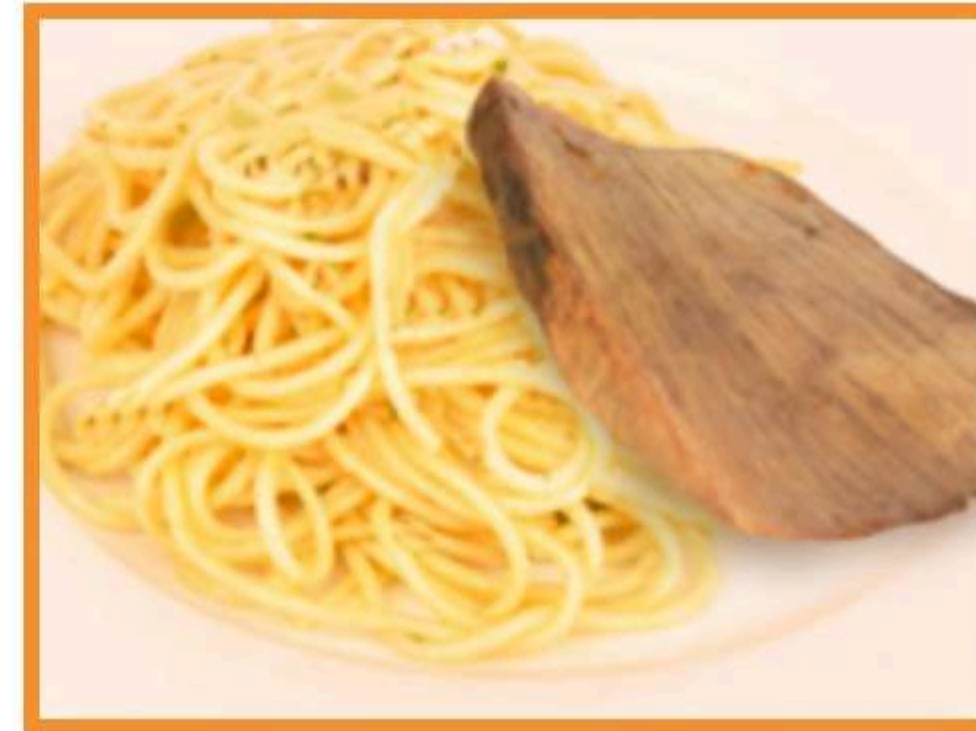
Asado al horno con spaghetti