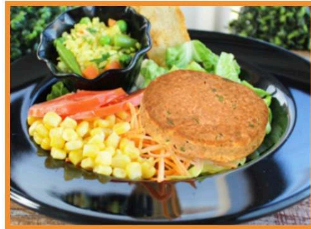
Croqueta de atún