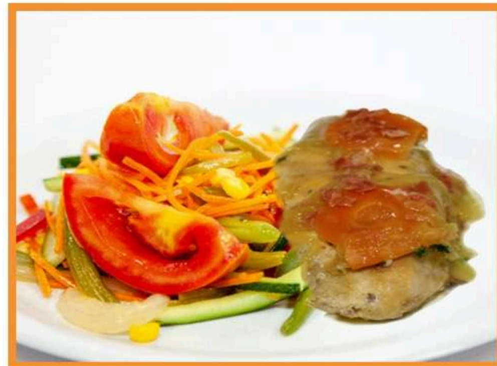
Pechuga de pollo guisada con verduras salteadas