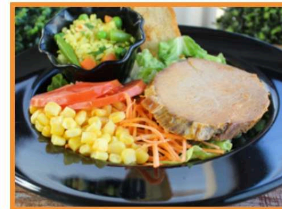
Asado de vacuno