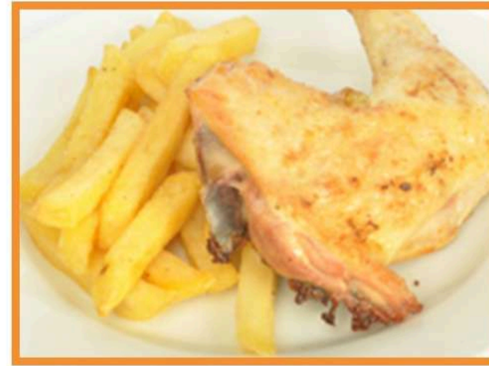
Trutro de pollo asado con papas horneadas