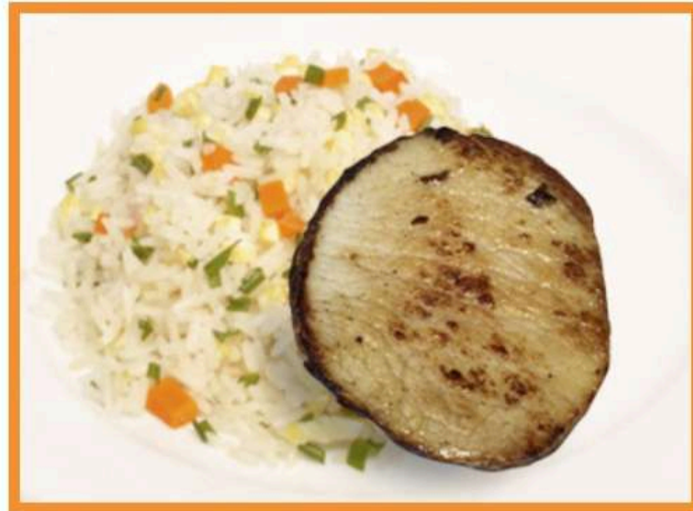
Asado de cerdo con arroz chaufán