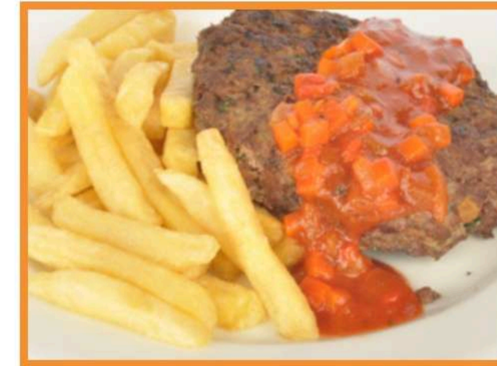
Hamburguesa napolitana con papas horneadas