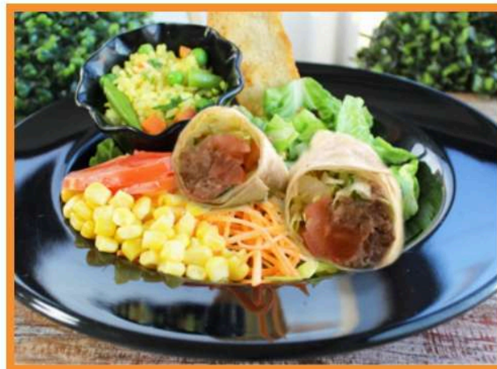
Wraps de palta pimentón poroto verde