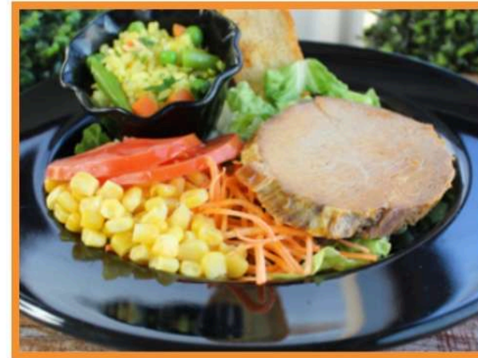
Carne al ajillo