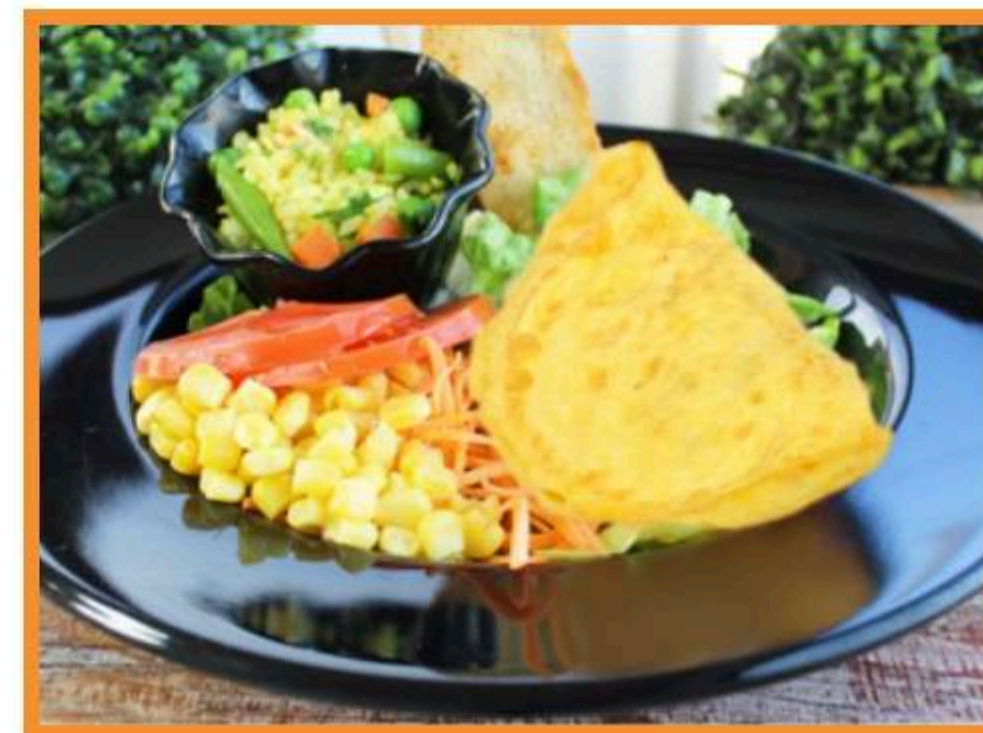
Omelette de p.verde acetuna en ratattouille de verduras