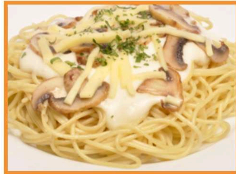
Salsa champiñón queso jamón con spaghetti