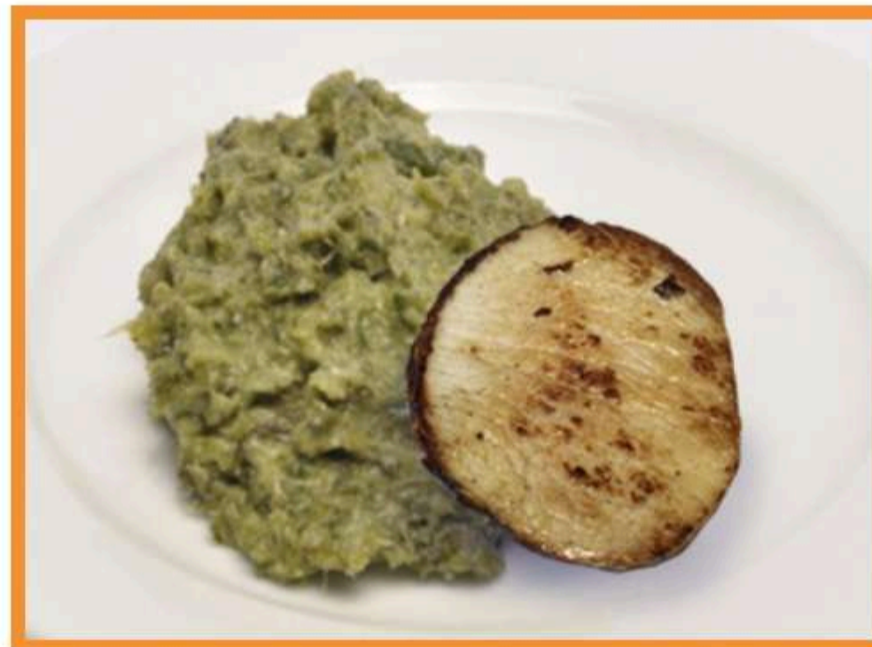
Asado de cerdo con acelga a la crema