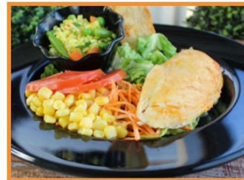
Pechuga de pollo asado