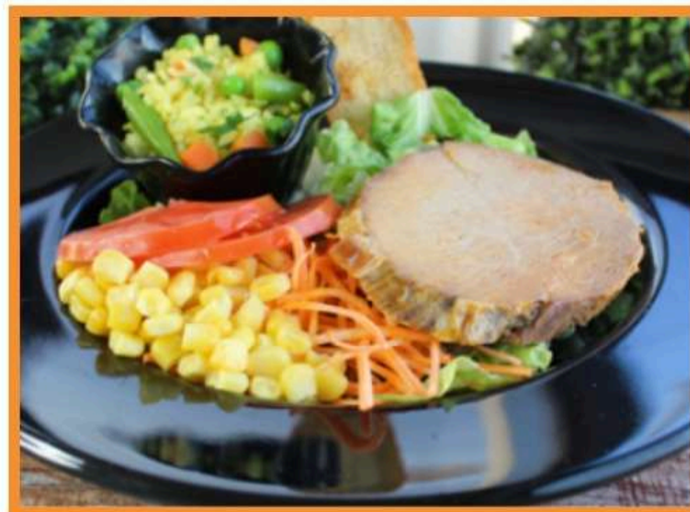
Carne al ajillo