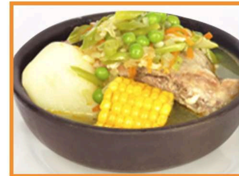
Cazuela de ave