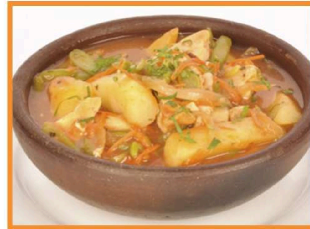
Estofado de cerdo