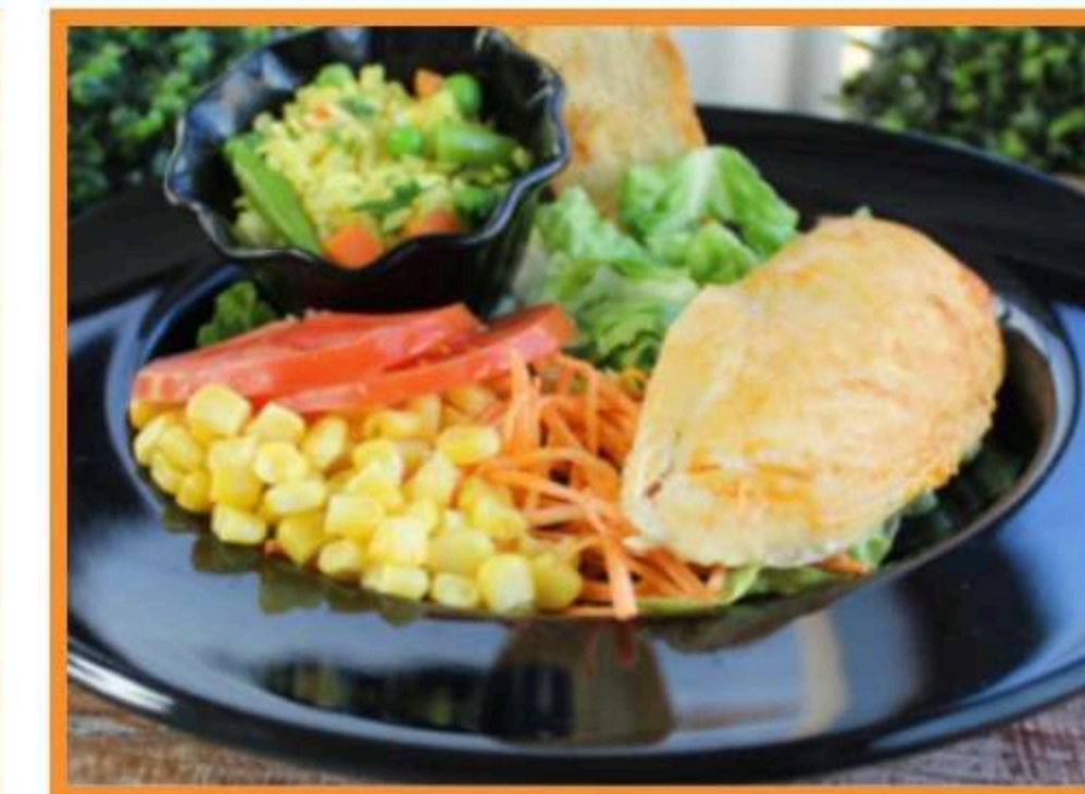
Pechuga de pollo asado