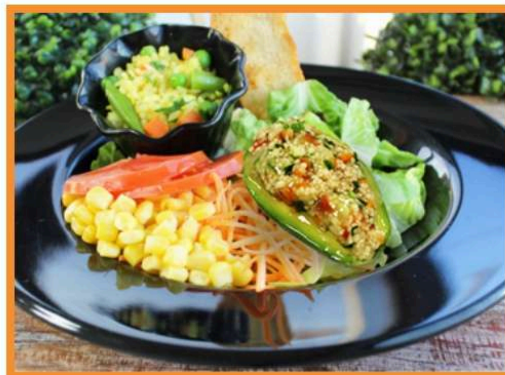
Palta rellena con taboulette de cuscús