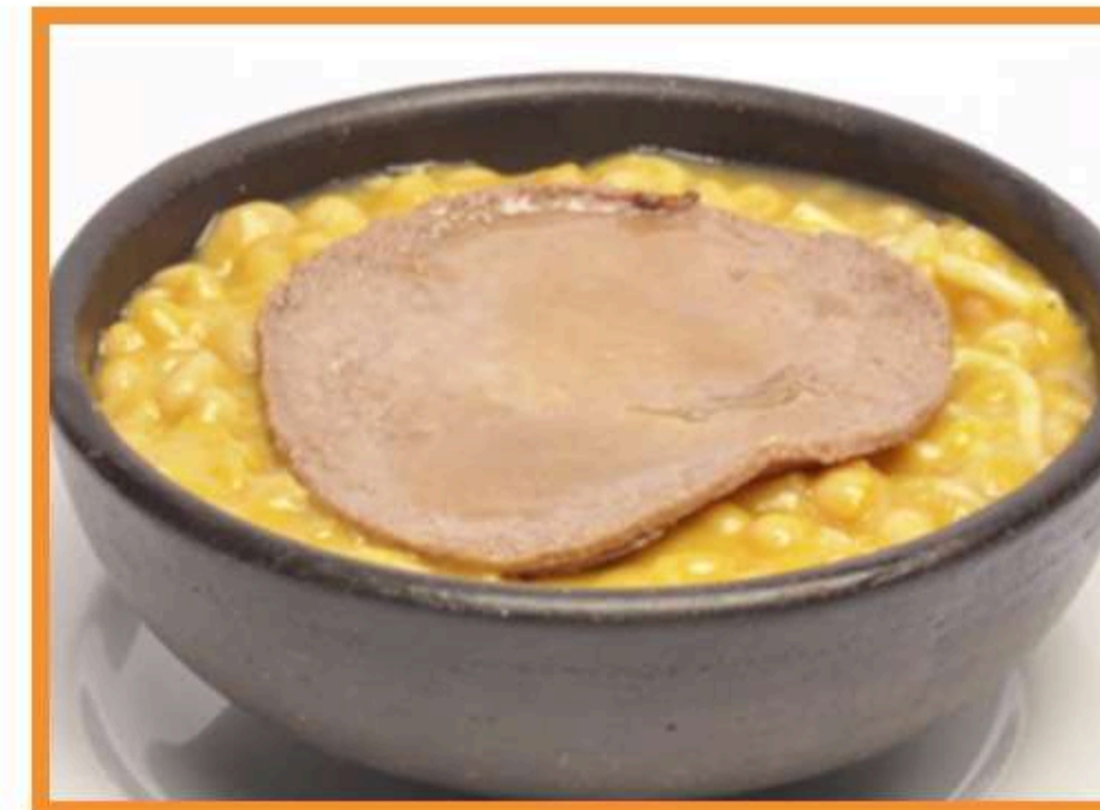
Porotos con tallarines y churrasco de vacuno