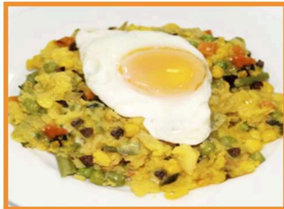
Charquicán de carne con huevo frito