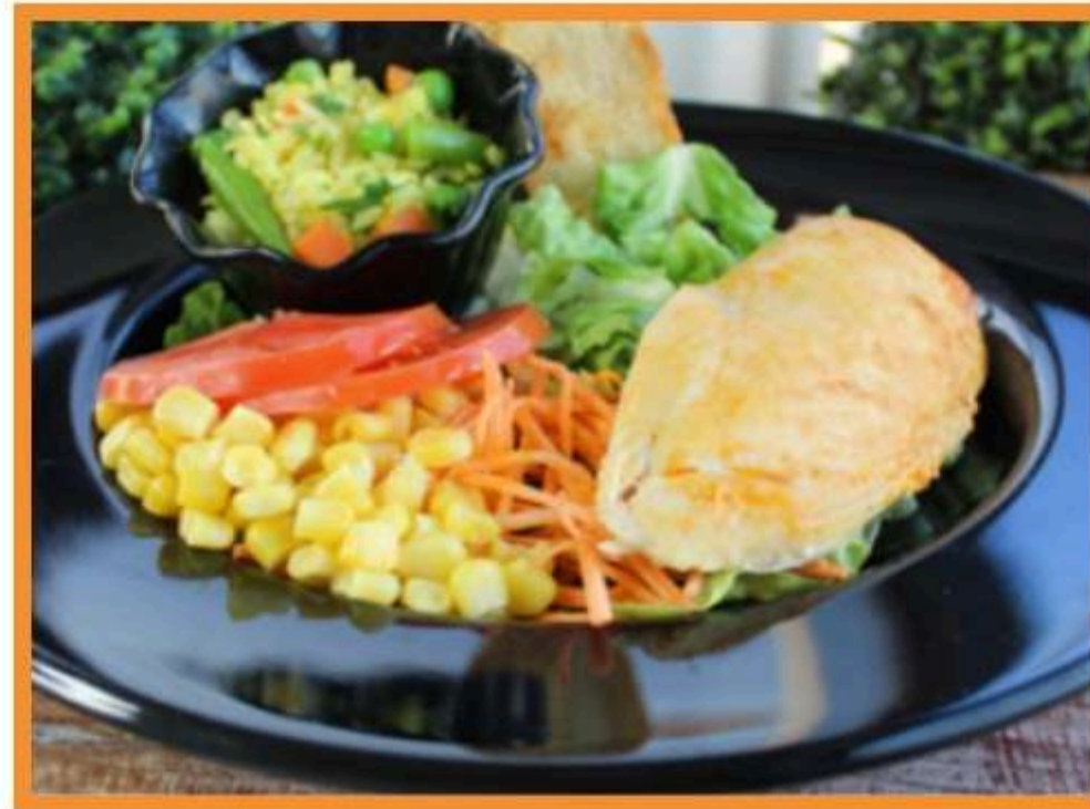
Pechuga de pollo asado