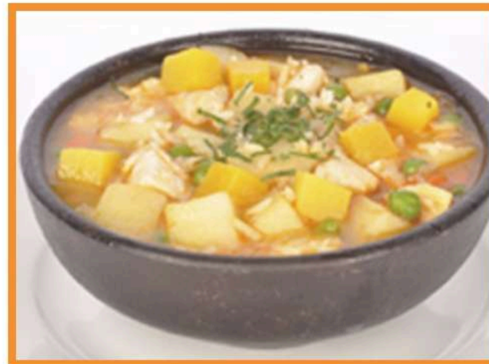
Carbonada de ave