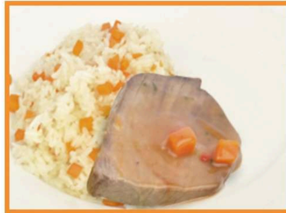
Carne a la cacerola con arroz graneado