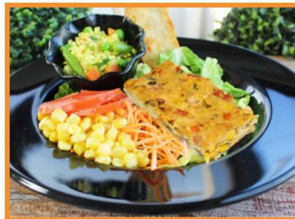
Tortilla de choclo