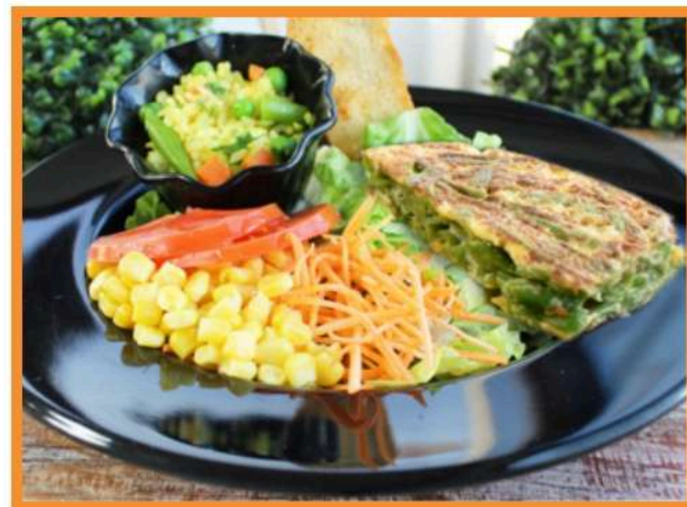
Flan de porotos verdes