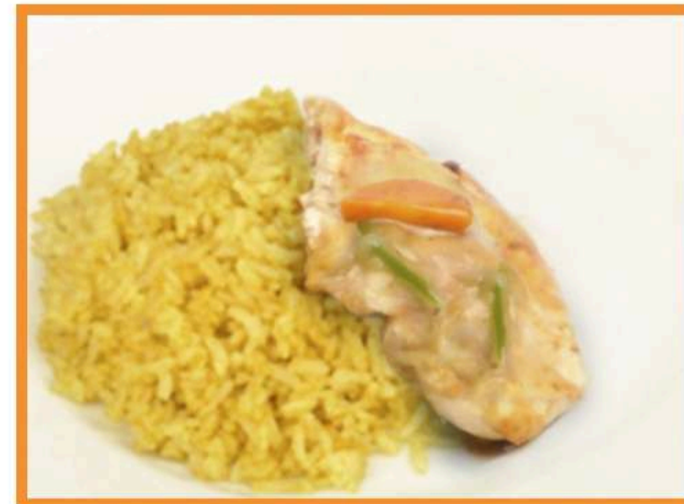
Pollo al jugo con arroz al curry