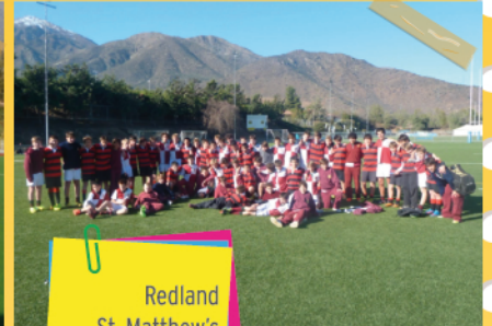
Redland St. Matthew's 7º básico Rugby