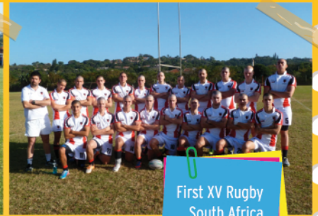
First XV Rugby South Africa Sports Tour