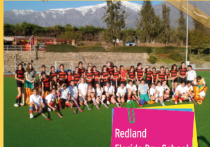
Redland Florida Day School 6º básico Hockey