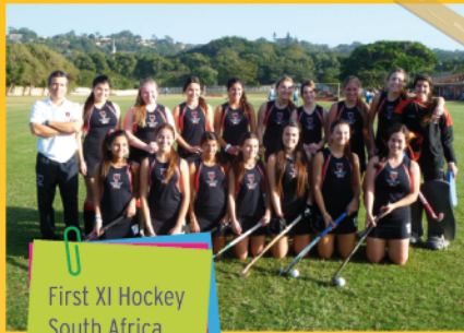
First XI Hockey South Africa Sports Tour

Ha sido un trimestre lleno de actividades físicas y deportivas que comenzaron con una espectacular gira a Sudáfrica con categoría Senior, también dimos inicio a los bilaterales de hockey y rugby. Además recibimos a los colegios argentinos (St. Matthew's, Florida Day School, St. George's, St. Brendan's y Sta. María del Pilar). No podemos olvidar la participación en los festivales y torneos de la ABSCh, como también la gira de los alumnos de 7º básico a Buenos Aires. En Educación Física vimos las unidades de gimnasia damas, básquetbol varones y folclore. Por otra parte, algunos profesores del departamento han podido participar en taller de perfeccionamiento.